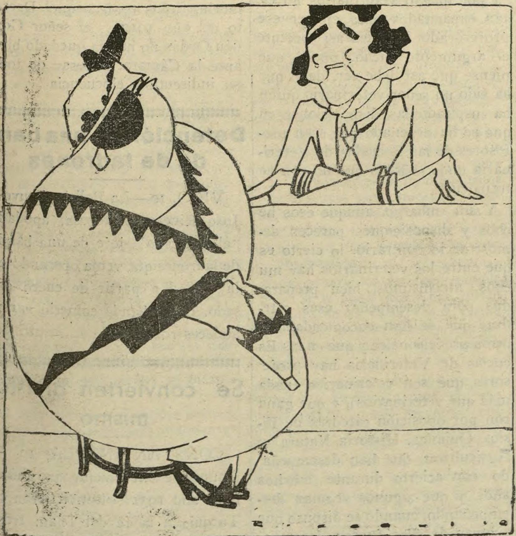
LA "MISS" QUE FALTA

—¿Quiere usted decirme cuándo elegirán "Miss Pesos Pesado 1932?"