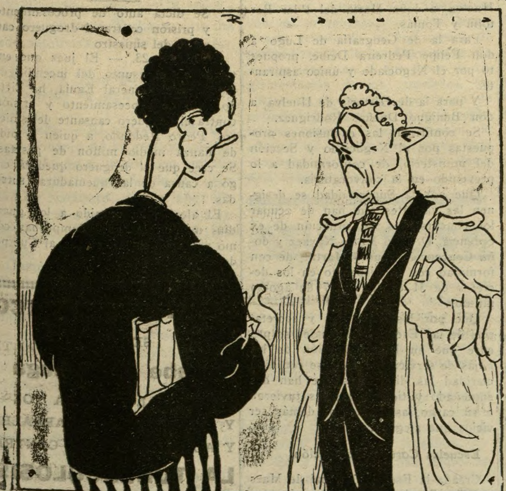
OTRA HUELGA ESCOLAR