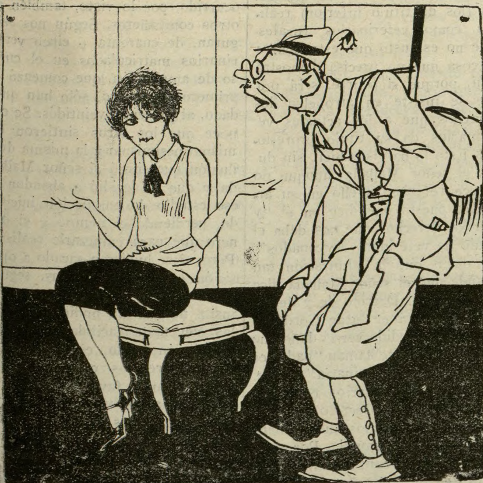
CAZA EN TIEMPO DE VEDA

BERLIN, 1.—Se ha publicado oficialmente la noticia de que el 5 del pasado había en Alemania 6.127.000 obreros en paro forzoso, señalando ese total 104.000 más que en igual fecha de 1931.