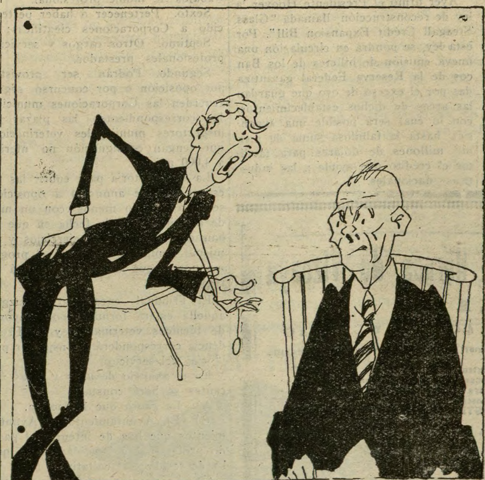
ENSAYO DOMESTICO DE UN DISCURSO PARLAMENTARIO

LONDRES, 4.—Pasan de 260 mil las personas que han visitado la Exposición de Arte Francés, en las ocho semanas que lleva abierta. Comprende las obras producidas por el genio galo en el período de los años 1200 1900. —(DIARIO UNIVERSAL).