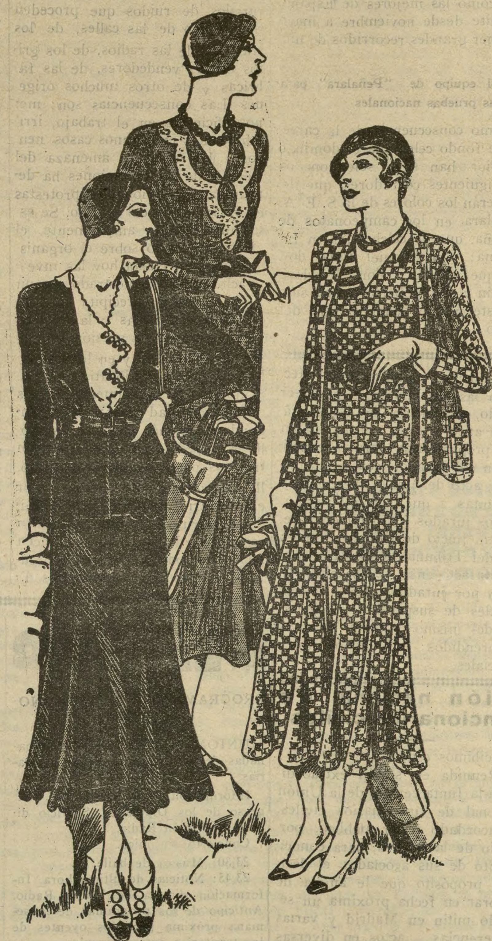
1.—Elegantísimo traje "jumper" en jersey de la Reina, lo mismo para figuras delgadas que gruesas. 2.—Otro elegante traje en tela de jersey, para jóvenes, acabado con adornos de crochet. 3.—Y un traje de tres piezas, en bordado de lana; la falda está ribeteada con crepé de China y el cuerpo tiene un cinturón de cuero con hebilla que forma contraste con el color. Estos tres trajes se hacen en todos los colores.

Si quiere usted hallarse en contacto con el mundo, lea el DIARIO UNIVERSAL. No deja de comunicar al público un solo suceso de interés internacional en su información extranjera.