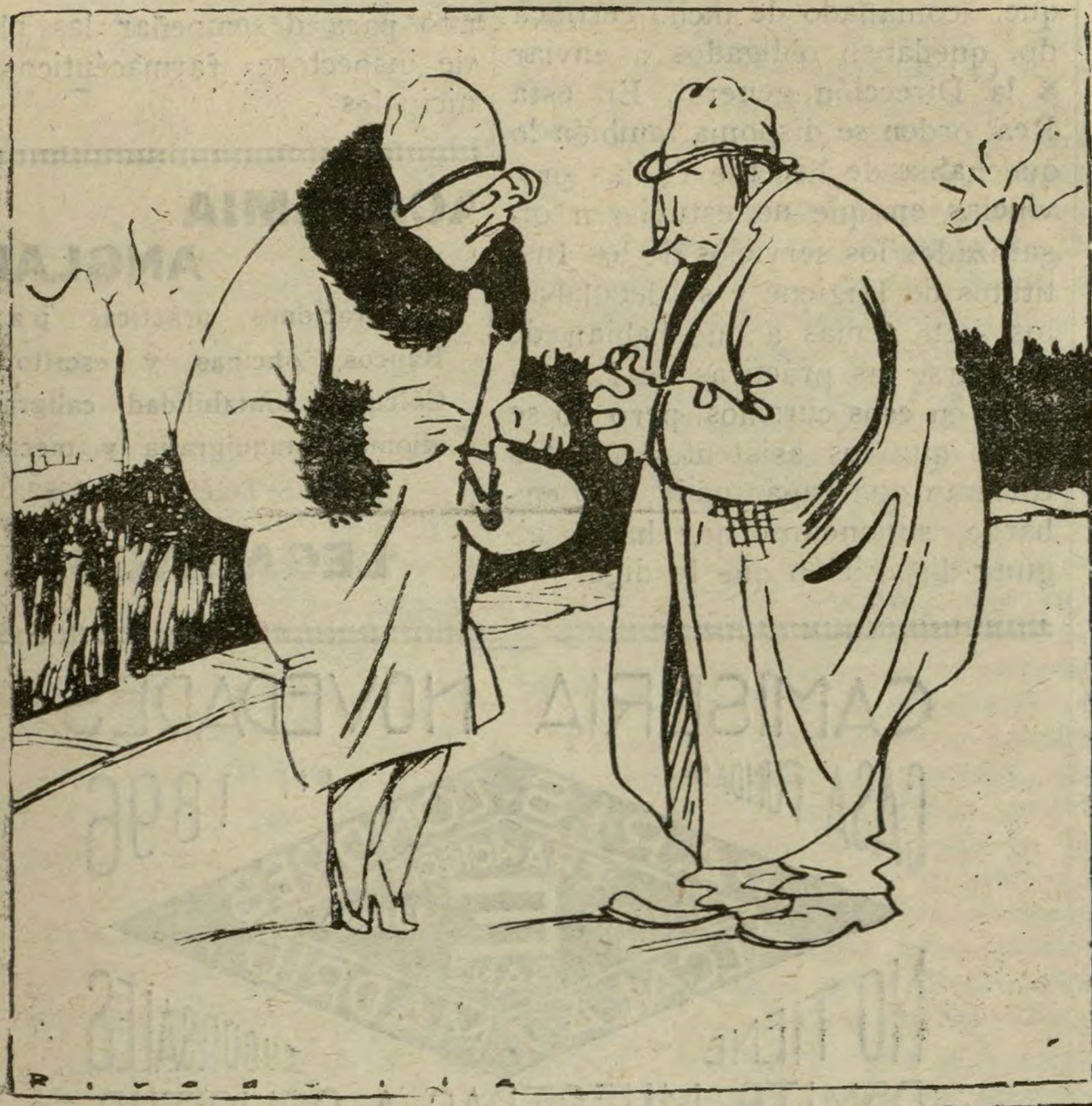
LA SEÑORA.—¿Usted cree que debo divorciarme? EL CABALLERO.—Ya, ¿pa ra qué?