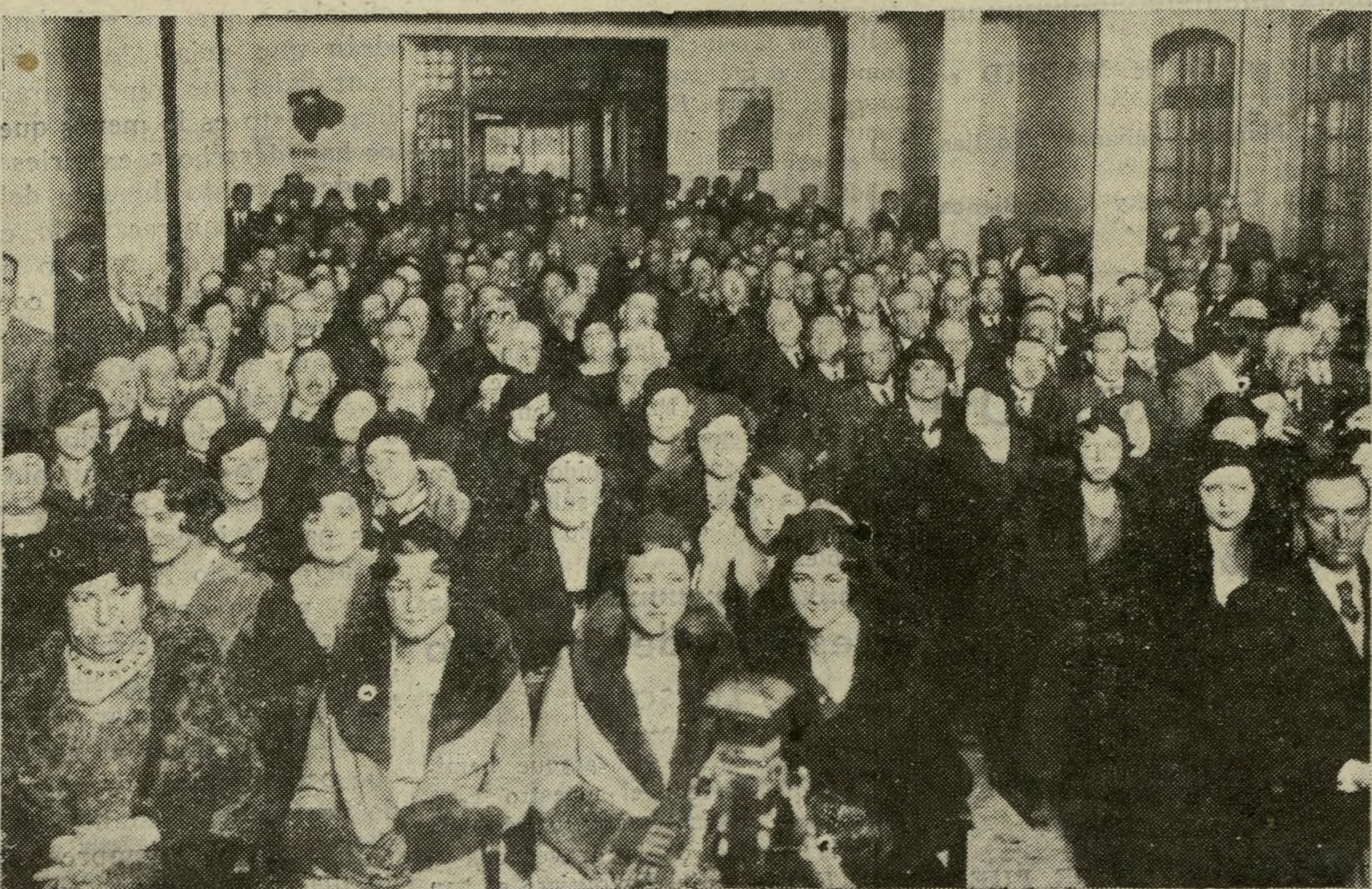
Aspecto del salón de la Sociedad “La Unica” durante la Asamblea de Defensa de la Propiedad Urbana.