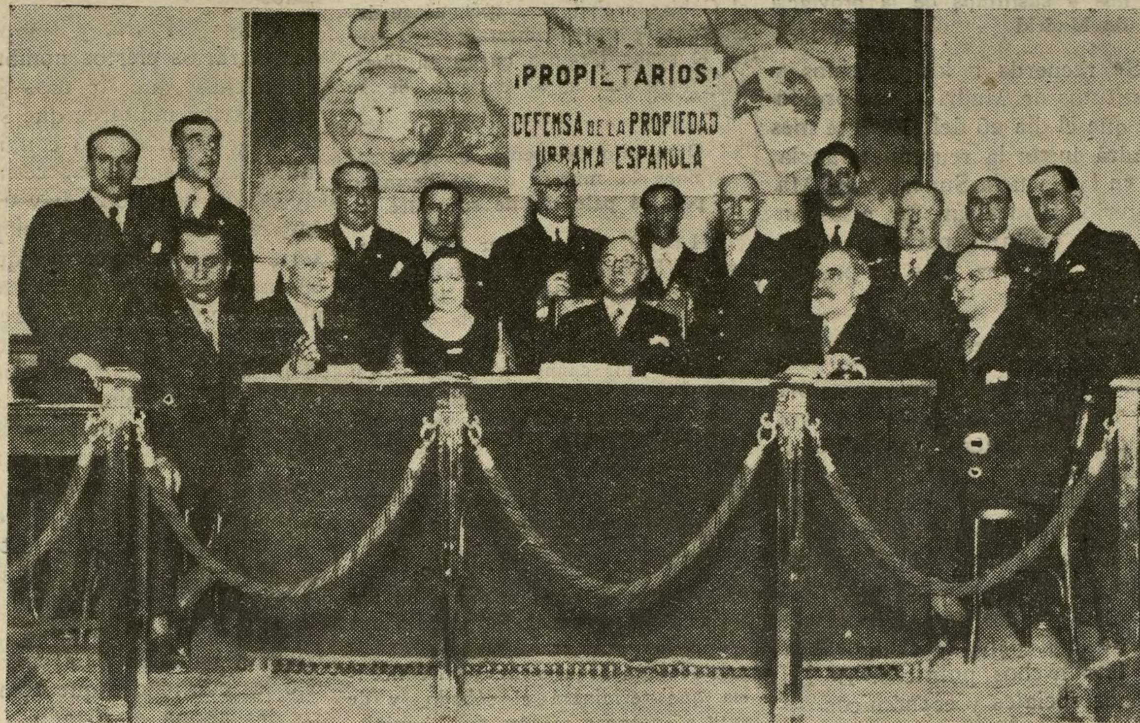
La mesa presidencial y los oradores de la Asamblea de Defensa de la Propiedad Urbana.

pietarios, en justa defensa de sus intereses buscan.