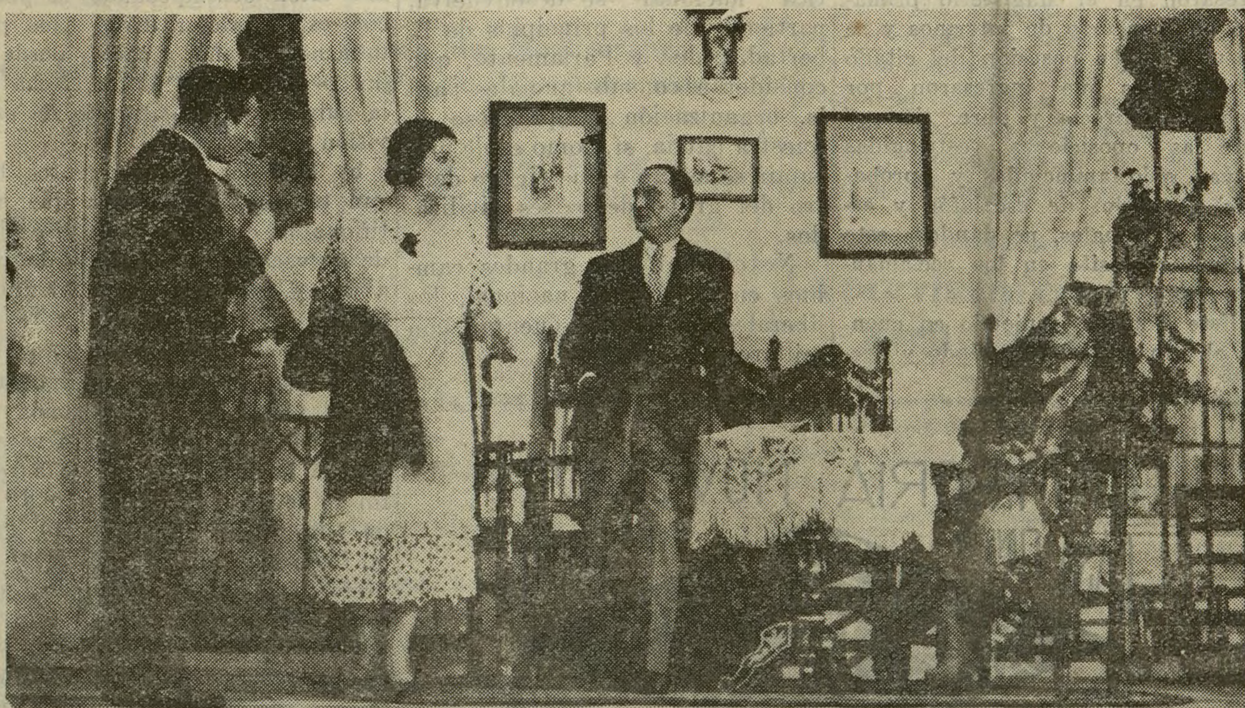
Una escena del primer acto de la comedia de Serrano Anguita, «Tres líneas de «El Liberal», que se estrena esta noche en el teatro Fontalba.