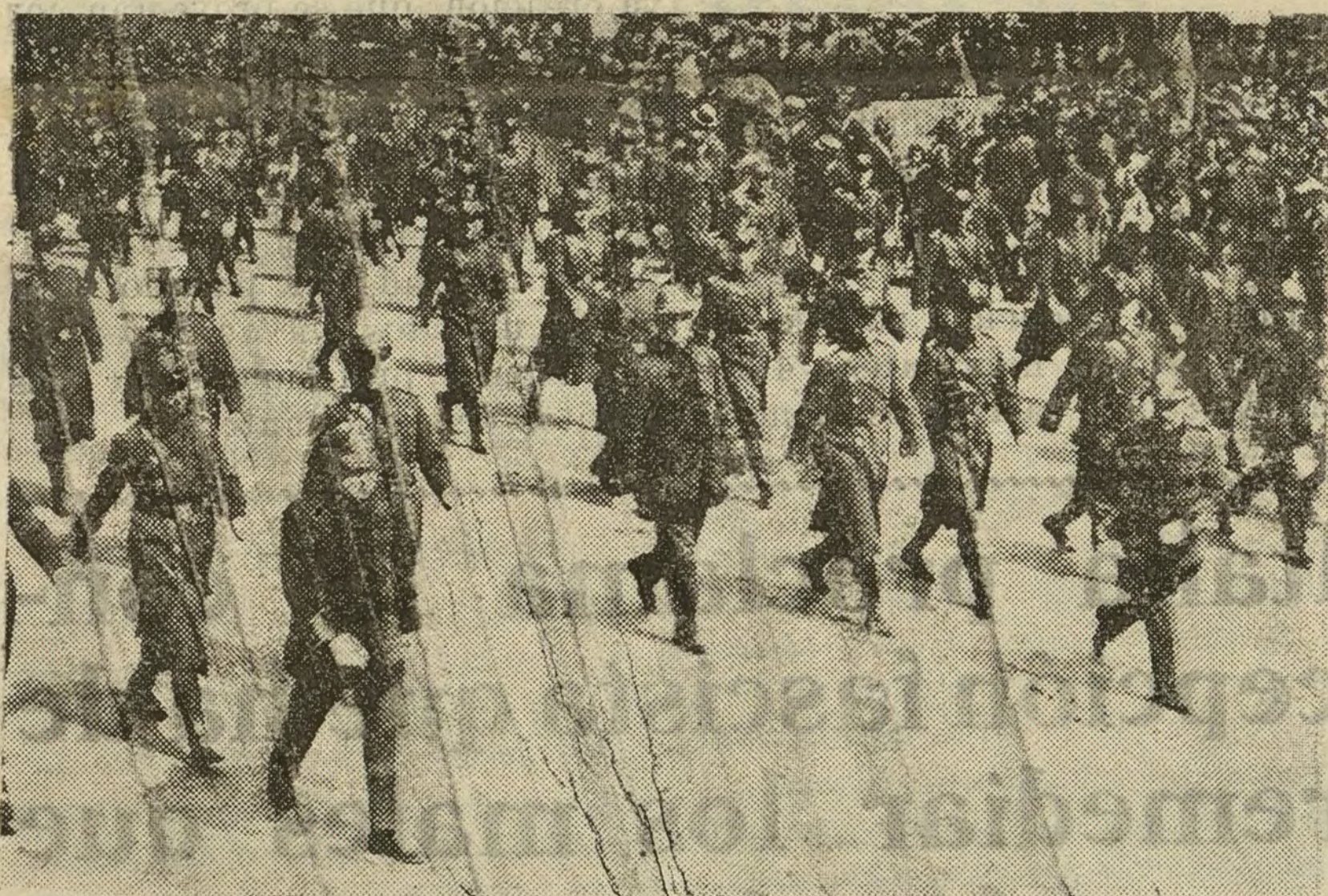
Uno de los momentos más interesantes del desfile.