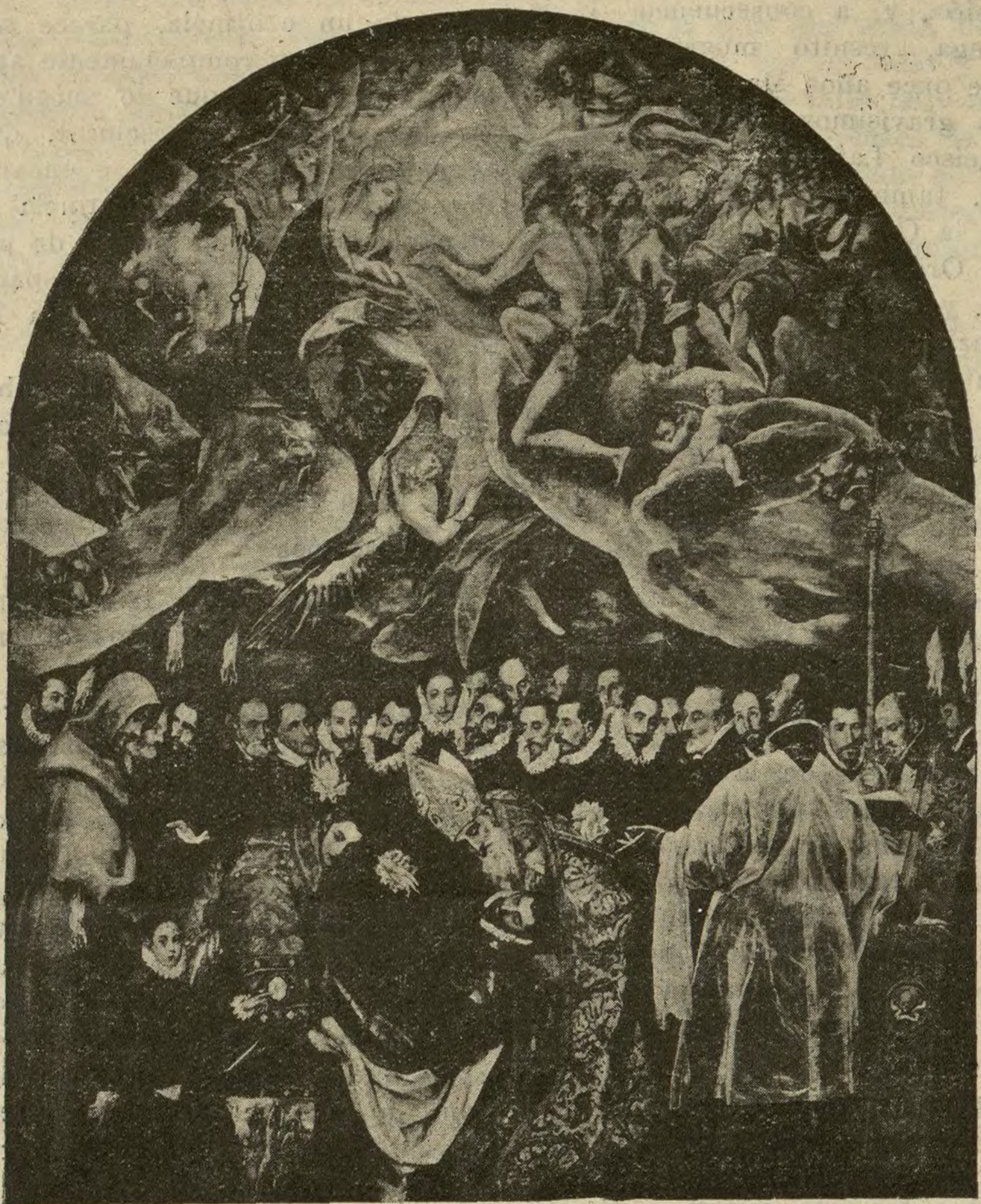
Uno de los más celebrados cuadros del Greco.

No se devuelven los originales que se nos remitan