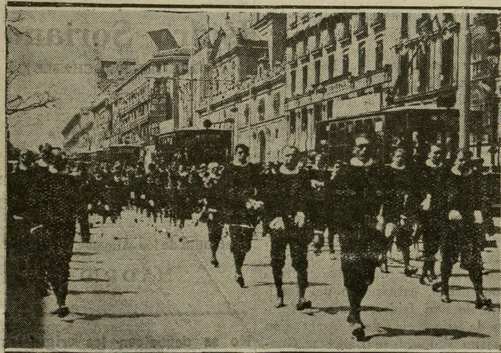
La orquesta Filarmónica de Córdoba, en las fiestas de la República

Bastó la sola presencia de los guardias de asalto, para que desistieron de su propósito y se disolvieron.