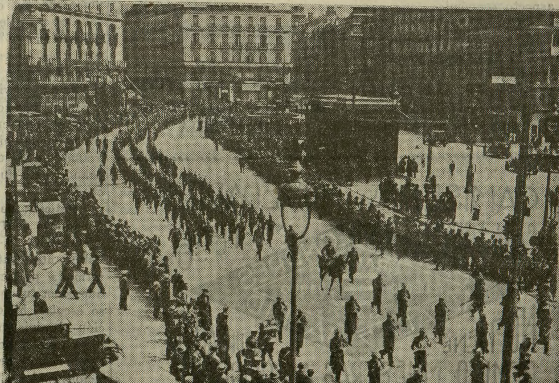
Aspecto de la Puerta del Sol al pasar ayer uno de los regimientos