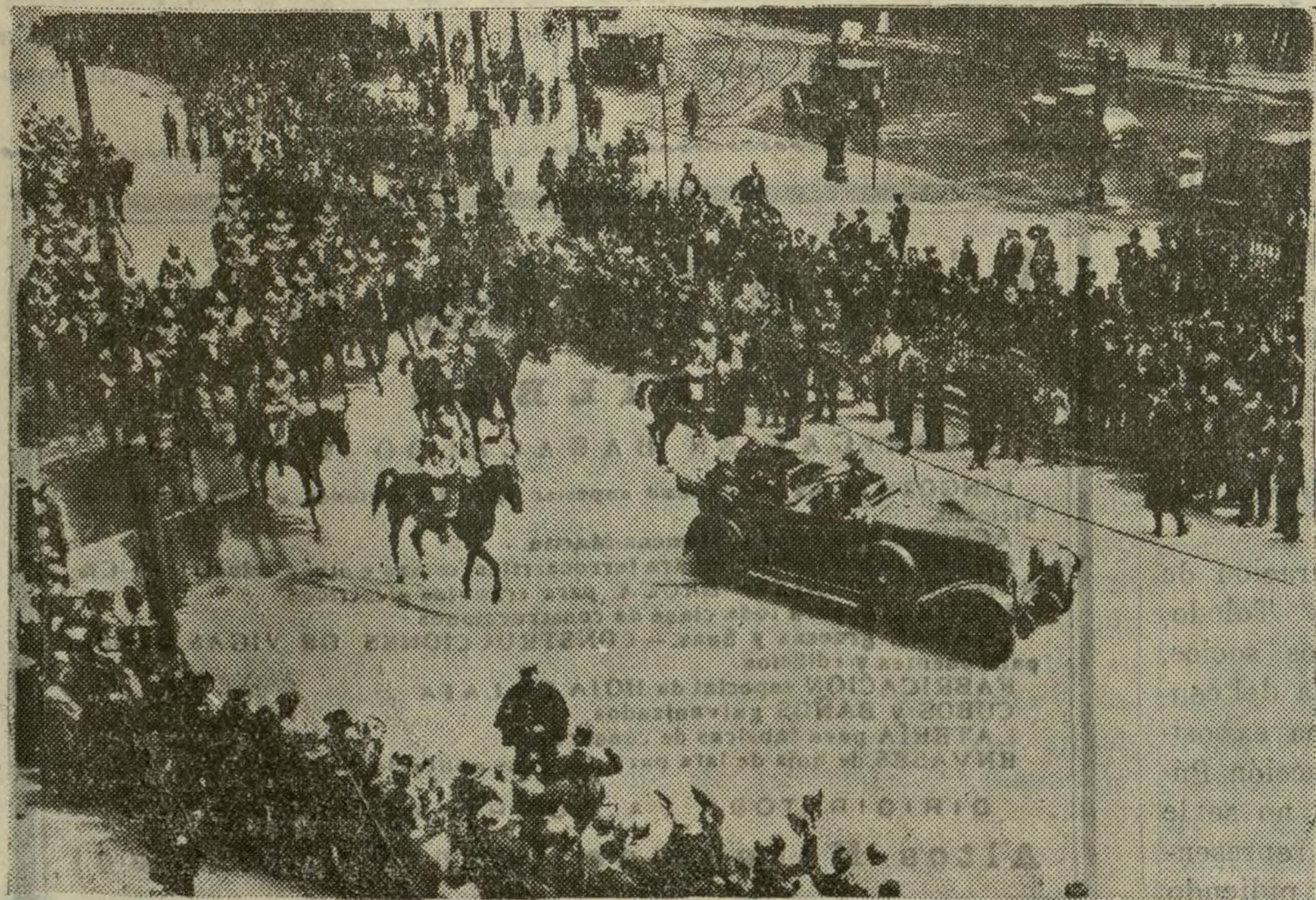
Aspecto de la Puerta del Sol al pasar ayer la comitiva presidencial.