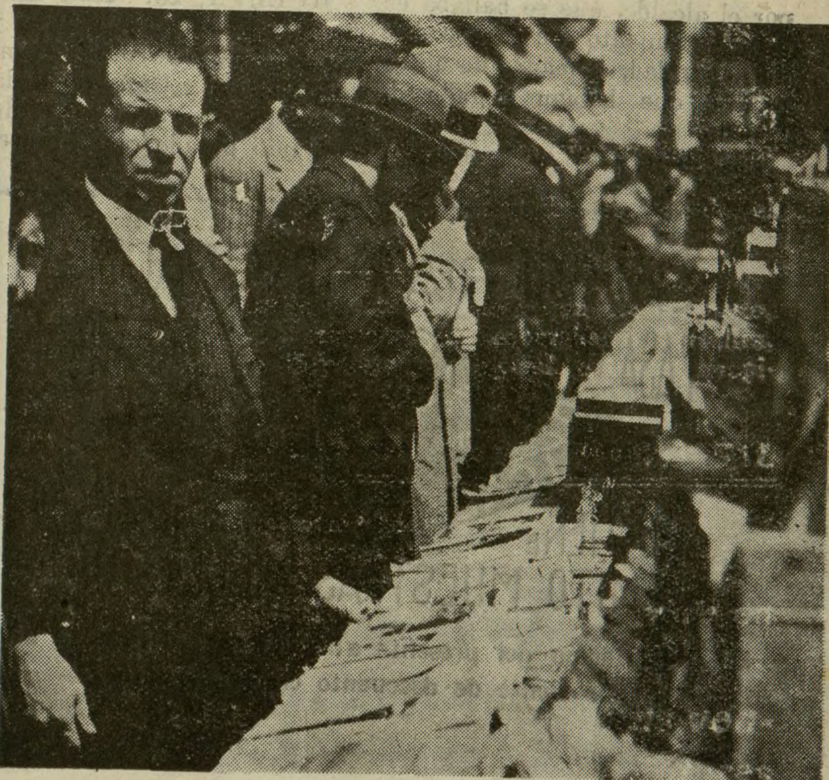
Un aspecto de la Feria del Libro.