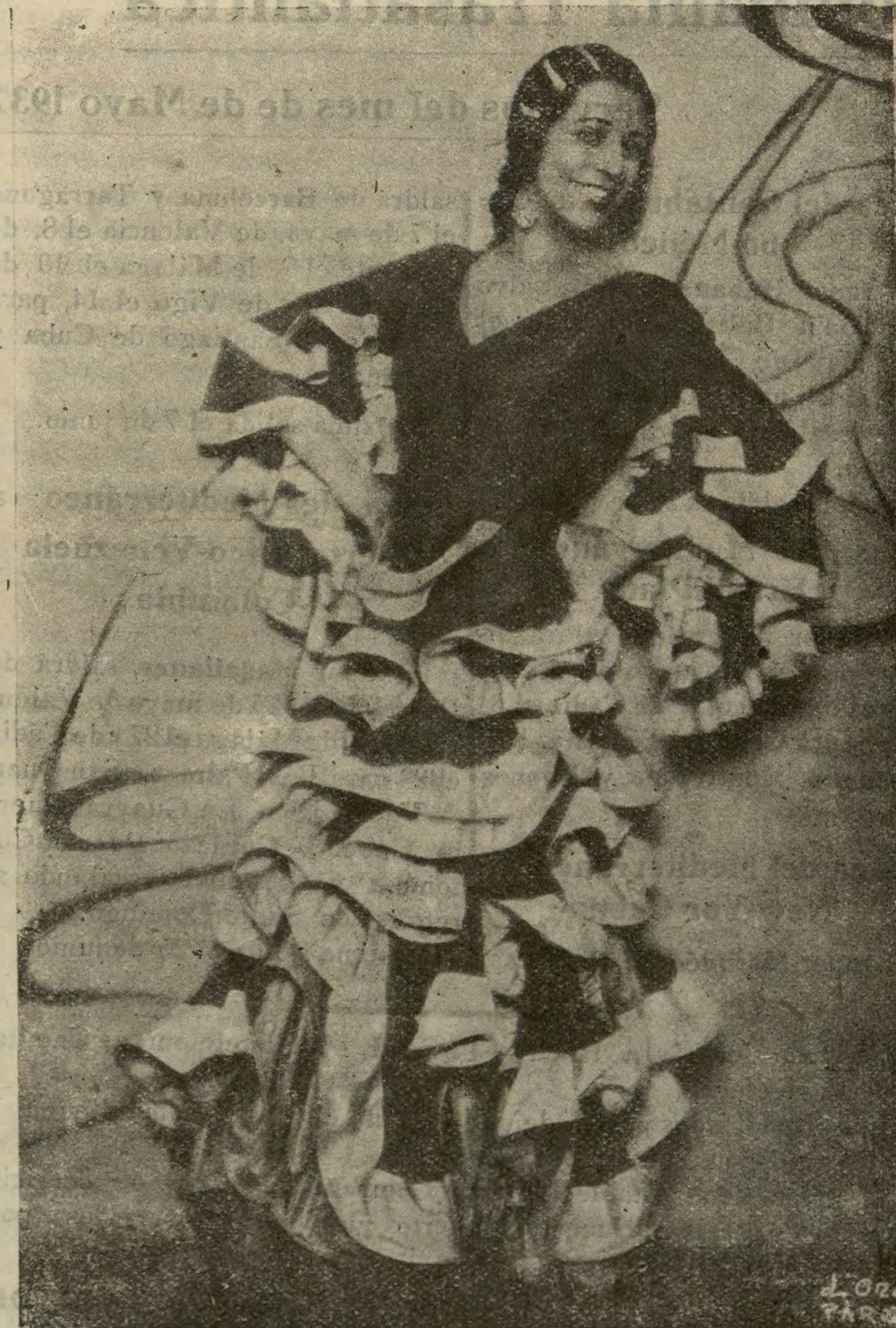
Antonia Mercé «La Argentina», que bailó ayer, en el Español