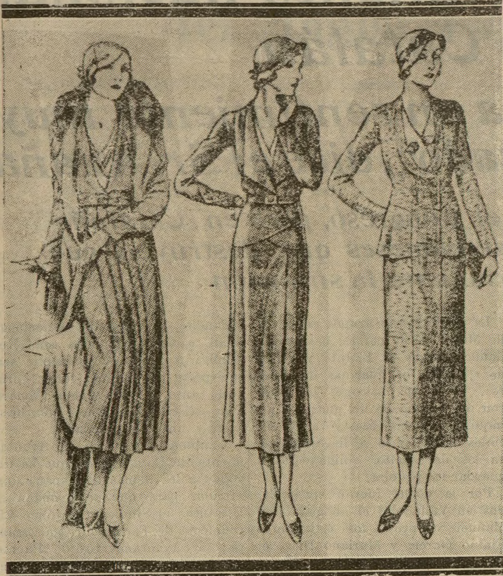
Tres modelos de traje de calle