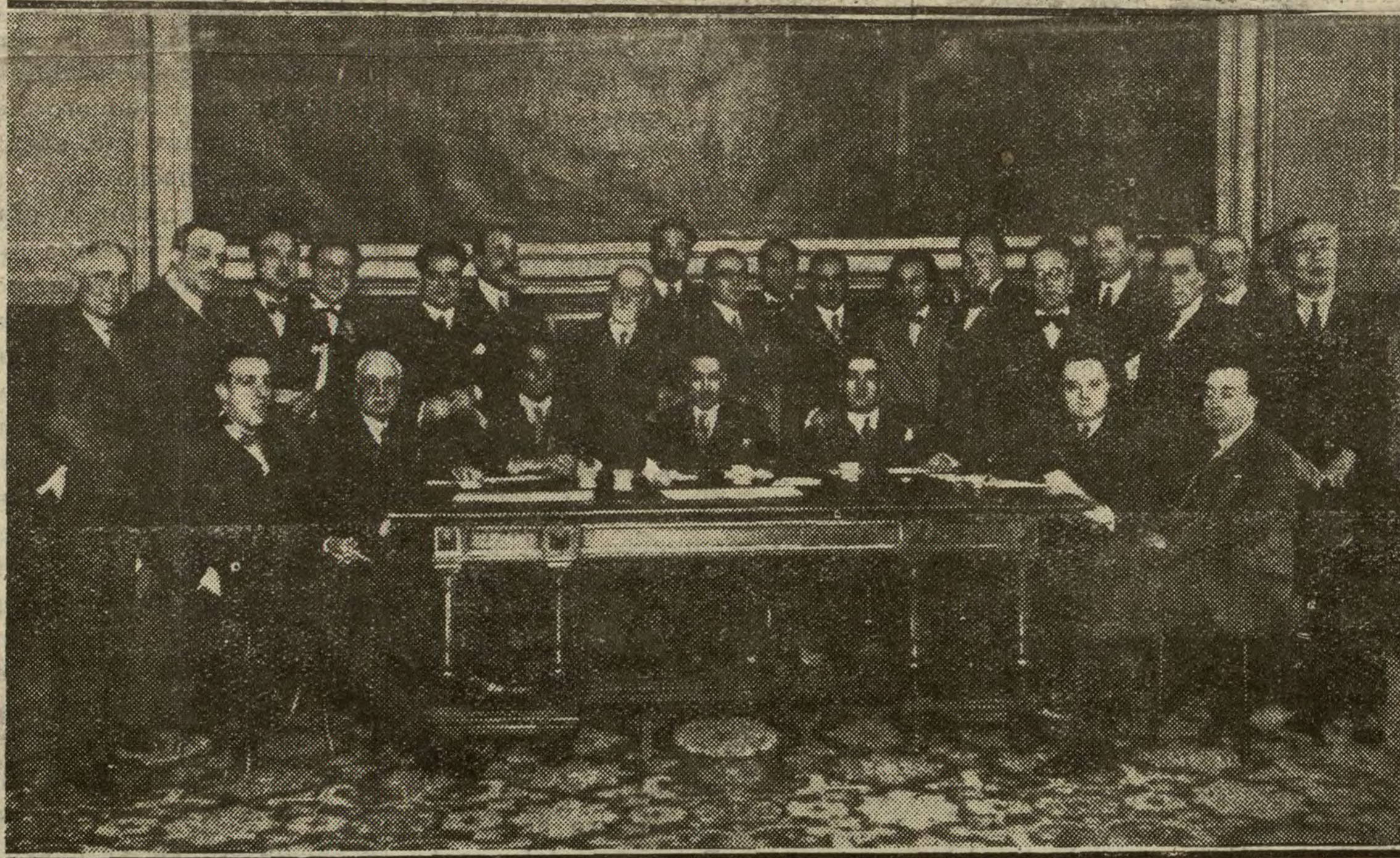
Los parlamentarios catalanes reunidos en una de las Secciones del Congreso.

Desde luego, mejor que la afirmación del conde de Romanones de (Continúa en cuarta plana.)