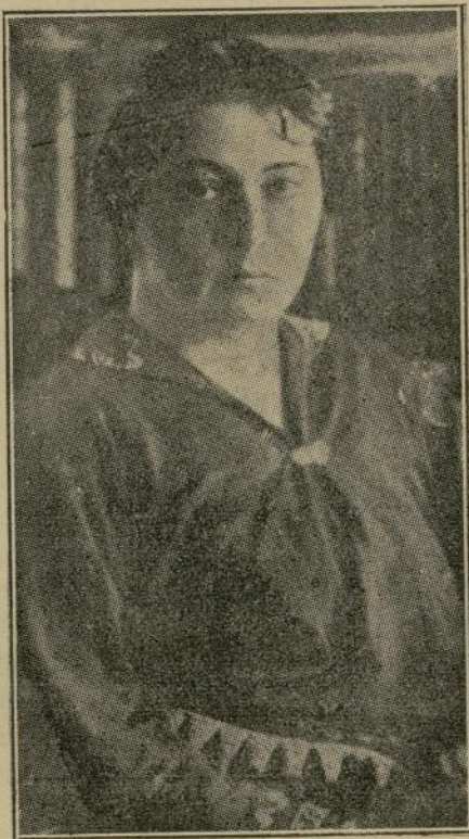
LA SEÑORA SIGRID UNDSET, ESCRITORA NORUEGA, QUE HA GANADO PREMIO DE LITERATURA DE ESTE AÑO

La sabiduría, las más de las veces, consiste en callarse más bien que en hablar, pues hay siempre tiempo para pensar, mientras que no siempre lo hay para decir lo que se piensa.