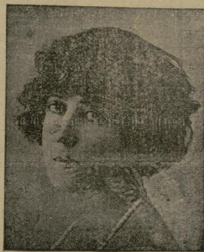
LA EXIMIA ESCRITORA CONCHA ESPINA QUE ACABA DE PUBLICAR UNA NUEVA NOVELA INTITULADA «ALTAR MAYOR» DE LA QUE HA HECHO GRANDES ELOGIOS LA CRITICA LITERARIA