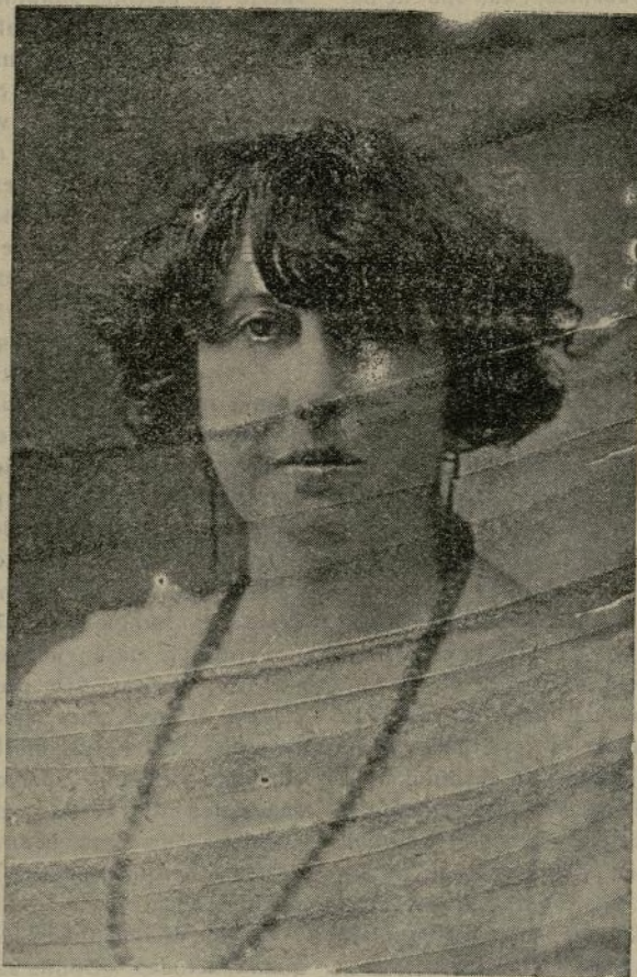
LA EXIMIA ESCRITORA CONCHA ESPINA QUE ACABA DE SER HOMENAJEADA POR EL PUEBLO DE SANTANDER, DEDICANDOLA UN JARDIN Y BIBLIOTECA QUE LLEVA SU NOMBRE

me faltaba tiempo, como me sigue faltando hoy, para acudir a los actos de sociedad a los que constantemente era invitada y en los que tanto tiempo se malgasta.