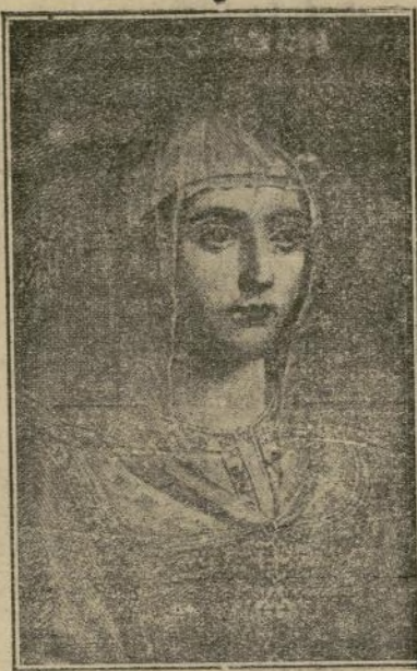
Isabel I de Castilla en los primeros años de su reinado

A las mujeres españolas de todas las clases sociales. A nuestras hermanas de raza y lengua de las Repúblicas hispánicas. — A las mujeres conscientes de la dignidad de su sexo, sin distinción de razas ni de naciones. A todos los hombres que sientan los ideales de Patria, Religión, Cultura y Familia y muy especialmente a los españoles de corazón de dentro y fuera de España.