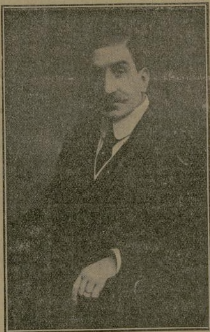
EL EXCMO. SR. DON JOAQUÍN SÁNCHEZ DE TOCA, PRESIDENTE DE LA REAL ACADEMIA DE CIENCIAS MORALES Y POLÍTICAS, AUTOR DEL ESTUDIO CRÍTICO SOBRE FELIPE IV Y SOR MARIA DE AGREDA, QUE PUBLICAMOS EN NUESTRO FOLLETIN.

La Real Academia de Ciencias Morales y Políticas premió en 1860 la obra de Concepción Arenal, La Beneficencia la Filantropía, y la Caridad , notable estudio de la acción benéfica en España. «El Estado—afirma la autora—tiene la obligación de sostener al desvalido: no pueden perecer en el abandono quienes cayeron, agotadas las fuerzas, rendidos al peso de