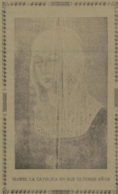
ISABEL LA CATOLICA EN SUS ULTIMOS AÑOS

mo indescriptibles; y alternando aquella enseñanza con la de todo género de conocimientos que ofrecían sus sabias lecciones a sus hijas, los hombres más doctos de Italia y España,