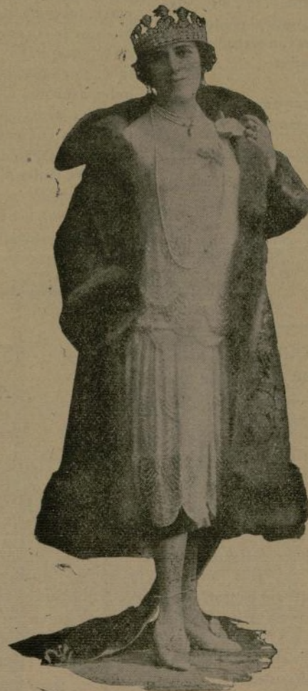
EXCMA. SEÑORA EMBAJADORA DE CUBA EN MADRID

Mi criterio es como la actuación y los discursos pronunciados, a favor de la intervención de la mujer en el desenvolvimiento de las actividades patrias como germen inicial y faro espiritual, que orienta los ánimos en sus diversas funciones excelsas de madre, esposa e hija.