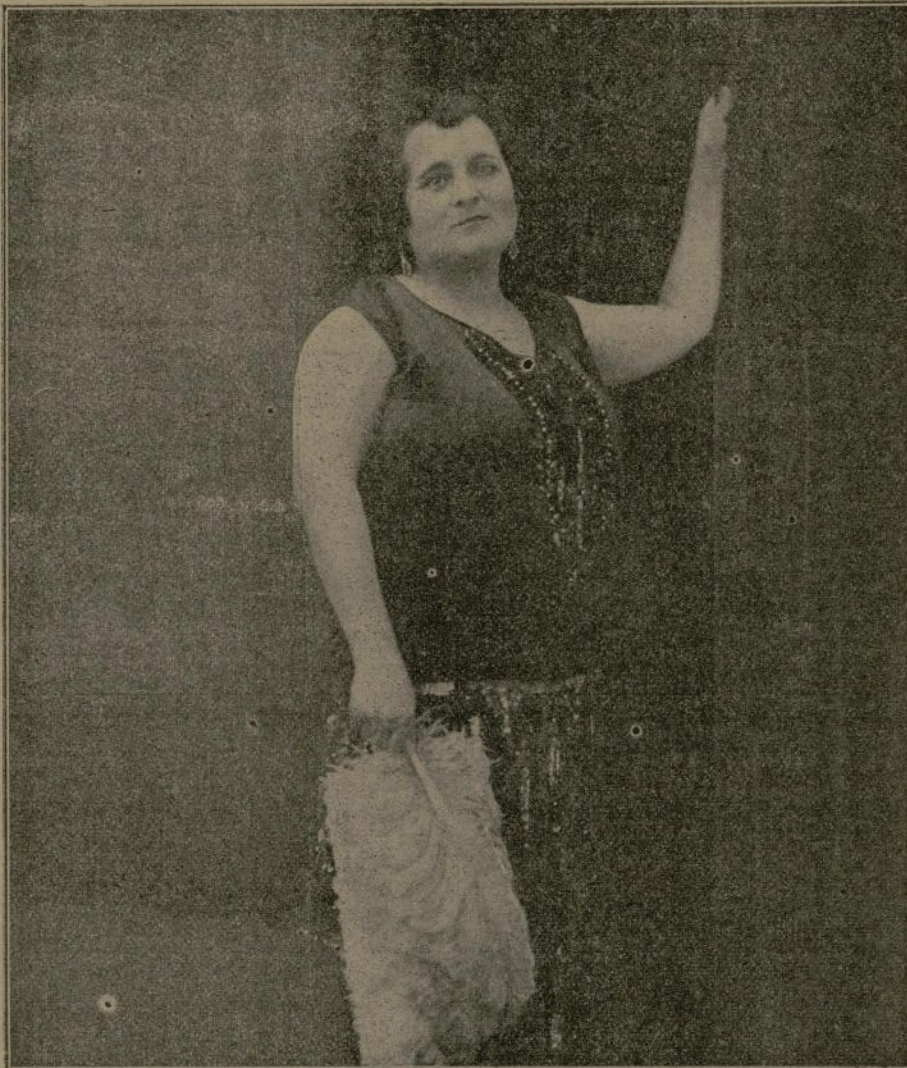
LA ILUSTRE ESCRITORA Y ENTUSIASTA FEMINISTA CARMEN VELACORACHO