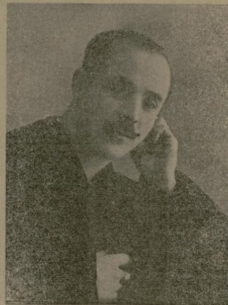
S. JOSE ASAN INTELIGENTE ARTISTA DECORADOR DE MUEBLES

Cuando un matrimonio, bien por disparidad de caracteres, de educación o de cariño, está divorciado moralmente, surgen los disgustos, los gritos y pala-