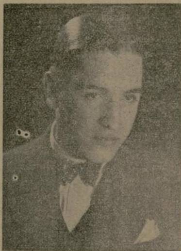
EL DOCTOR S. QUESADA CORNIDE, ILUSTRE CUBANO, HOMBRE DE CIENCIA Y DE LETRAS