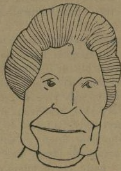
DOÑA BLANCA DE LOS RÍOS