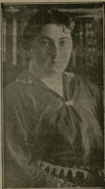
El premio Nóbel de Literatura a la escritora noruega Sigrid Undset

Estocolmo 13.—La Academia Sueca ha concedido los premios Nóbel de Literatura para 1927 y 1928 a la escritora noruega Sigrid Undset.