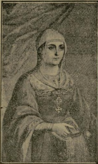
ISABEL LA CATOLICA EN SUS PRIMEROS AÑOS DE REINA

París.—La colonia norteamericana está de luto con la muerte de madame Edward Tuck, generosa bienhechora, a la que París debe el hospital Stoll, que funciona desde hace veinticinco años; una Escuela del Hogar, donde