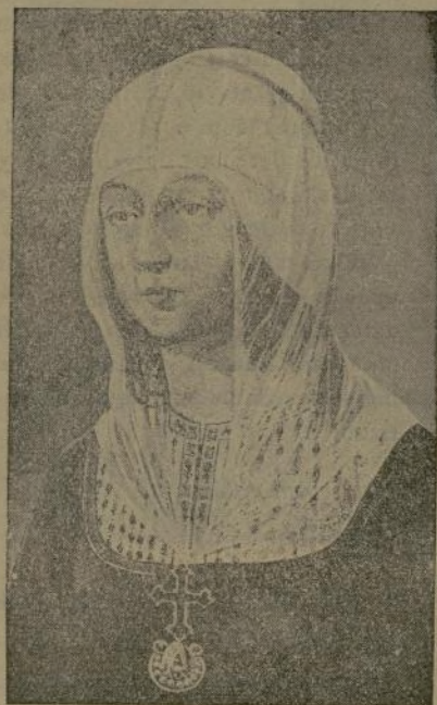
ISABEL LA CATOLICA EN SUS ULTIMOS AÑOS

El día 26 de este mes cumple el 424 aniversario del fallecimiento de esta Reina, ocurrido en su palacio de la plaza Mayor de Medina del Campo, el 26 de noviembre de 1504.