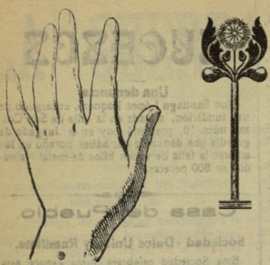
Mano que se lava con este jabón.