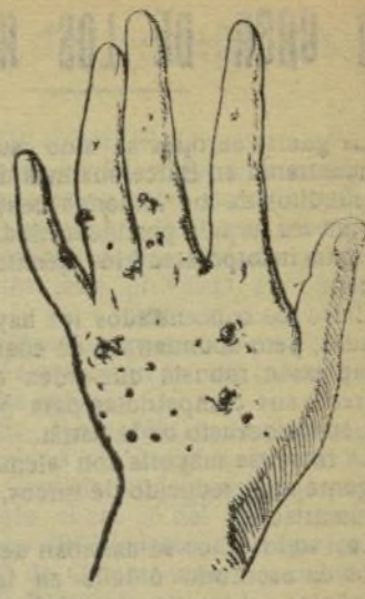
Mano que no se con este jabón.