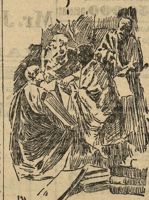
Fragmento de la decoración mural para el palacio del obispo

Cumpliendo mi misión de reporter, he querido conocer personalmente a este muy notable artista—que en la sombra trabaja, ajeno al bulir de los intrigantes,—y de una nue-