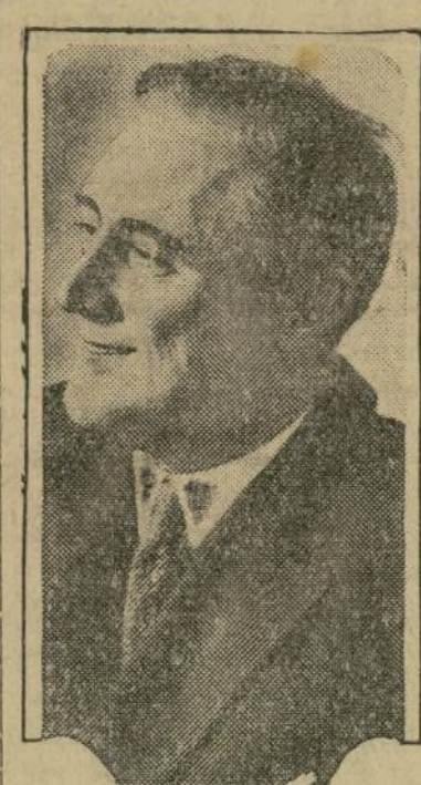
FRANKLIN D. ROOSEVELT

Se había fijado de primera intención una reunión para hoy del comité especial sobre la materia, en la esperanza de que sería posible completar el texto del protocolo para la firma por los delegados bolivianos y paraguayos.