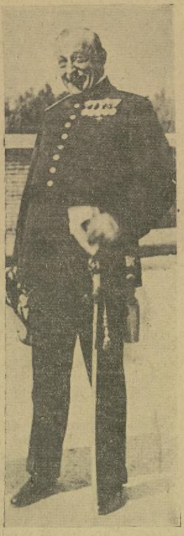
Cral. Primo de Rivera

“Aun se resalta alguna vez no obstante los fuertes frenos puestos al carro del libertinaje, en su marcha hacia el imperio de la arbitrariedad o de la coacción, diciéndose sus seguidores que marchaban, impulsados por la libertad. Que pocos de los que invocan su nombre son capaces de practicarla manteniendo la justicia y el derecho, oyendo y atendiendo a los humildes y desamparados y siendo tolerantes con el pensamiento y la conducta ajena. Nada de eso. Y menos de Y duro. Todos contra la idea de justicia y equidad por lo visto no ofrece puesto en sus gradas más que a facinorosos y hombres ciegos por la pasión y los tropiezos por la política. Garantías y recursos para todos y por todo, como si el gobierno fuera infalible a toda idea de justicia y equidad y por lo común, ya gracias a Dios, no existen los jurados populares, eludidos y coaccionados, para decidir sobre la vida y honor de los ciudadanos y en cambio, ninguna garantía superior para la ciudadanía contra las pasiones o errores de los jueces buscados en el buen