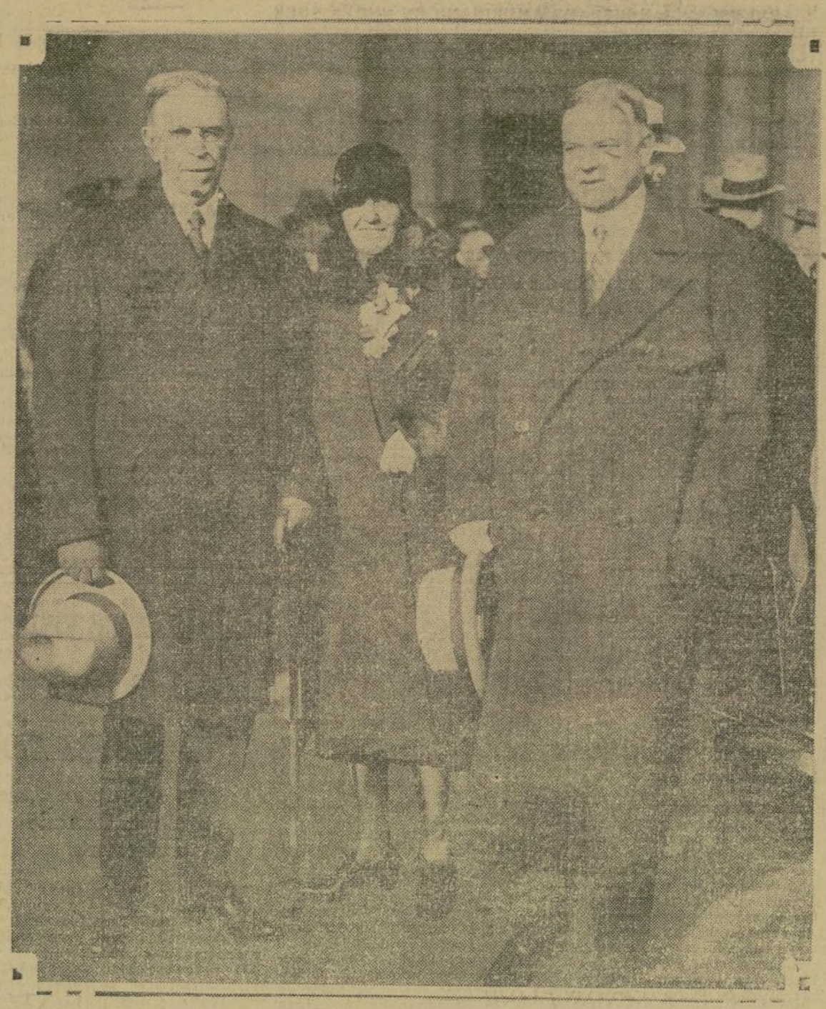
Entre el limitado número de personas que se encontraban en Washington esperando la llegada del presidente-electo de los Estados Unidos Herbert Hoover, quien en compañía de su señora llegó en la tarde del domingo a la capital, estaba su acompañante de gabinete y director de la campaña electoral republicana doctor Hubert Work (izquierda).