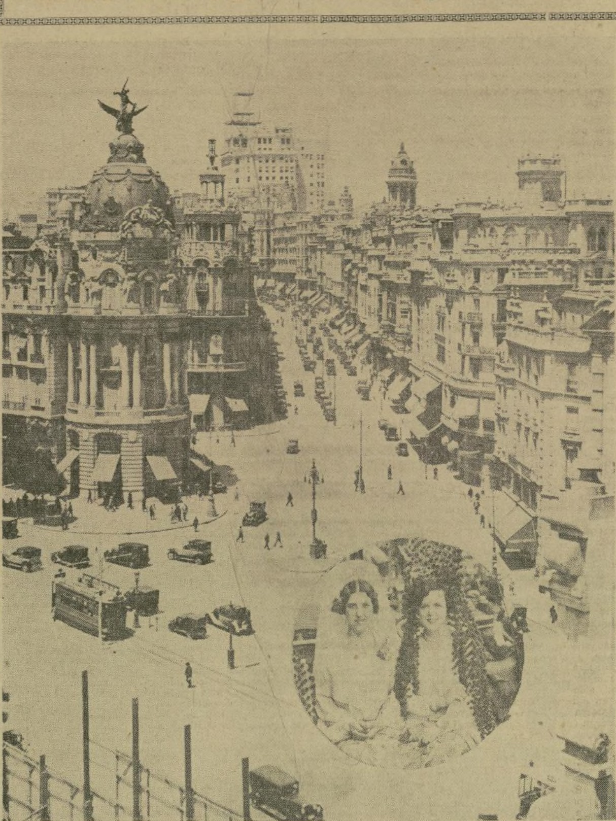
Hermosa vista de la Avenida del Conde de Peñalver, una de las secciones de Madrid que más atraerán la atención de Mr. Burton Holmes.