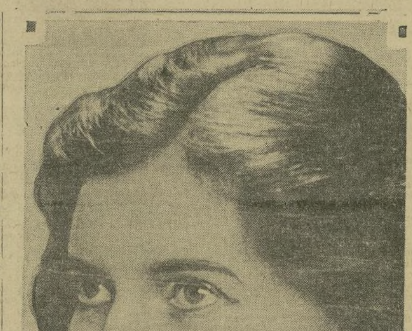
Ethel Barrymore en su papel como protagonista de "The Kingdom of God".

La fama de los hermanos Quintero ha llegado hasta los centros teatrales norteamericanos, como llega la del propio Sierra, de Benavente, de la compañía de los hermanos Quintero, antitesis de "Canción de Luna", en inglés, caro está, reina ya enorme interés por su presencia en Broadway, hasta que el senador de New Mexico pueda comparecer.