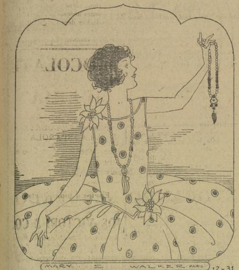
La ventaja de hacer nosotros mismos los collares, es que éstos tendrán su artística individualidad.

Los collares de piedras o perlas que no son auténticas al de valor que hacen indispensables en su uso respondiendo a estas dos necesidades: primera completan el conjunto de nuestra indumentaria, y segunda dan una nota de color indispensable muchas veces. El individualismo en las joyas. La ventaja de hacer una misma los collares es que siempre tienen un amplio surtido sin especializarse en particulares gustos; esto es lo que hace que éste no cambie todo lo rápidamente que nosotras deseamos.