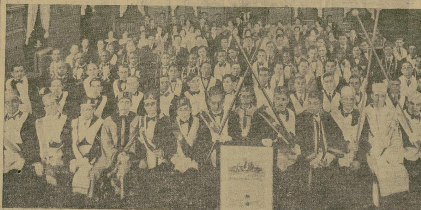
Ceremonia efectuada con motivo de la inauguración y toma de posesión de los directores