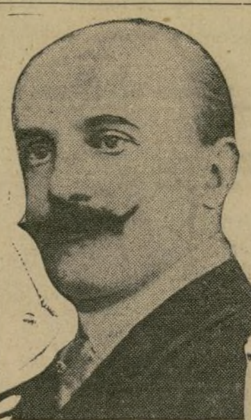
M. José Caillaux

CHARTRES, Francia, enero 10. (A).—José Caillaux, expresidente del gobierno francés, ha resultado herido en un accidente que le ocurrió al dirigirse a París a ocupar su cargo en el Senado, para encabezar la oposición contra Poincaré.