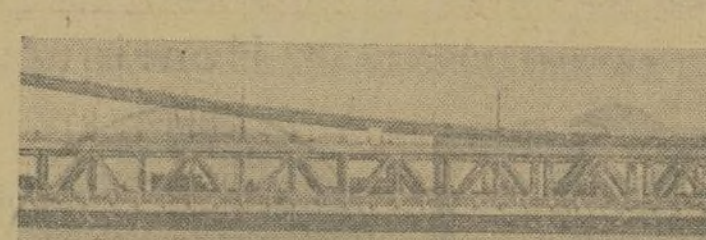
El buque insignia de la flota del Atlántico de los Estados Unidos, "Texas", se encuentra actualmente navegando en dirección a la base que la armada estadounidense tiene en Guantánamo, Cuba, donde se realizarán maniobras de invierno.