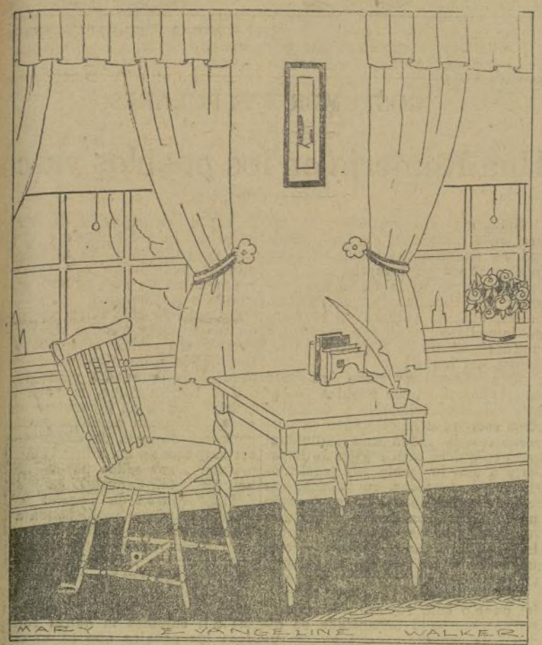
La decoración moderna de las casas, aunque simplista, requiere también el arte femenino.

El arte es algo intangible que se puede ser buena o mala. Todo en nuestro pensamiento, en nuestra alma y hasta en nuestras pequeñas acciones. No está, solamente, en los museos con estatuas y cuadros famosos o en los