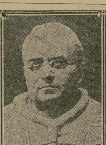
SU SANTIDAD PIO XI

El indio aimará de Bolivia será llevado al lienzo