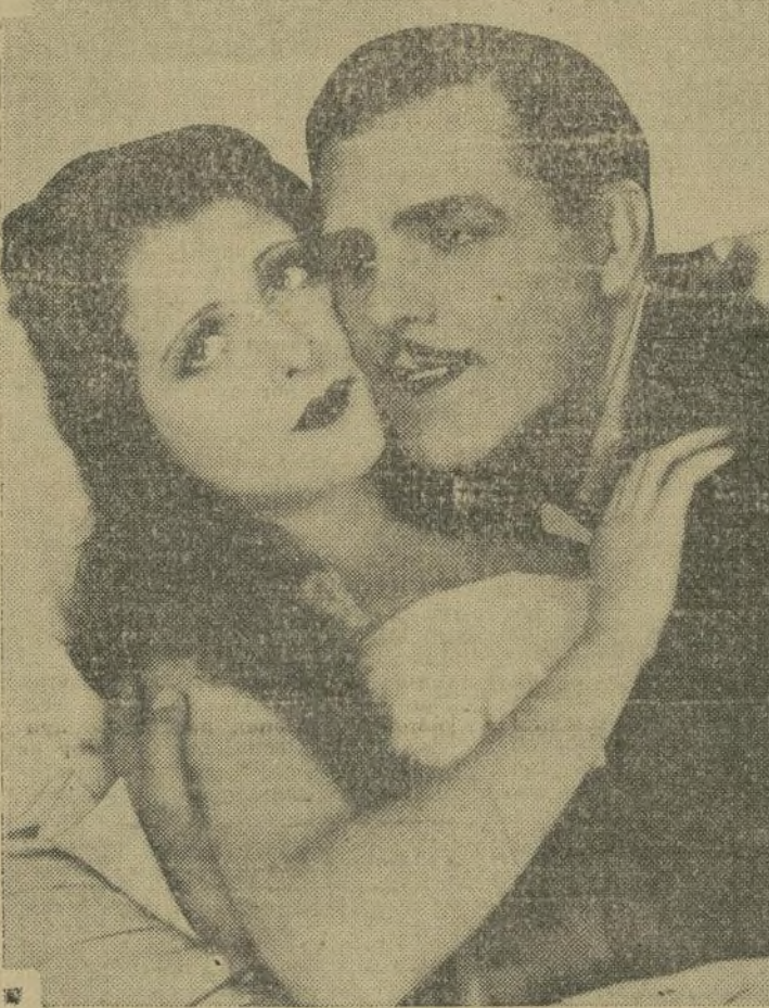
Nadie podrá negar que Antonio Moreno conoce sus escenas románticas. He aquí al popular actor español en "Adoration", un título muy apropiado a la historia que encierra la cinta. Se está exhibiendo en el "Starb Street".