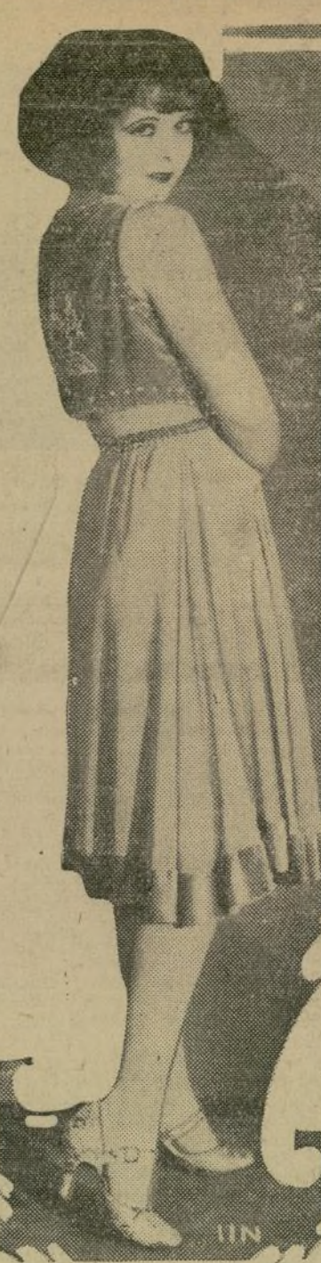
Clara Bow, la eterna "flapper"

del teatro, aparece aquí estrenando un original modelo de crepé color de rosa obscuro y terciopelo que ha sido designado especialmente para despertar la envidia de más de una "elegante."