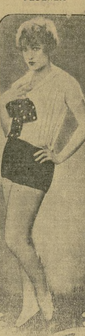
Lily Danita, la gentil estrella de la pantalla, se vio sorprendida últimamente con la maligna influencia. Muchos de sus admiradores rogaron por su pronto restablecimiento.