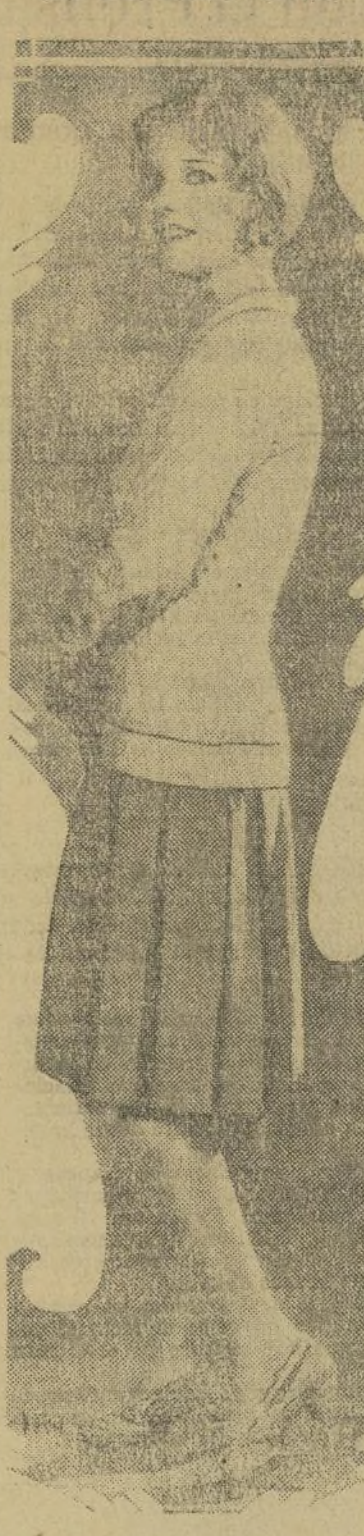
Una sencilla falda plisada, una elegante blusa de punto, unos zapatos chics, unas medias de color de carne y un cuerpo elegante completan esta admirable fotografía de Anita Page.