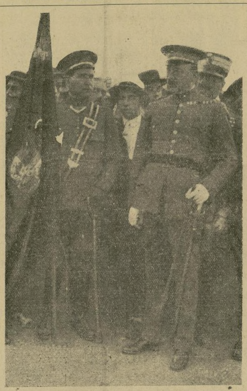
El presidente del Consejo de Ministros de España, fotografiado durante la jura de la bandera, celebrada el año último en Madrid. "El movimiento militar ha sido sofocado prontamente", sostiene el general Primo de Rivera en sus últimas declaraciones oficiales.