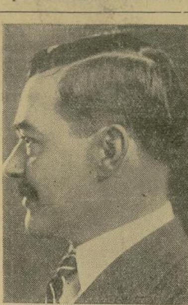
Dr. Vicente Mejía Colindres

Toma hoy posesión de la presidencia de Honduras