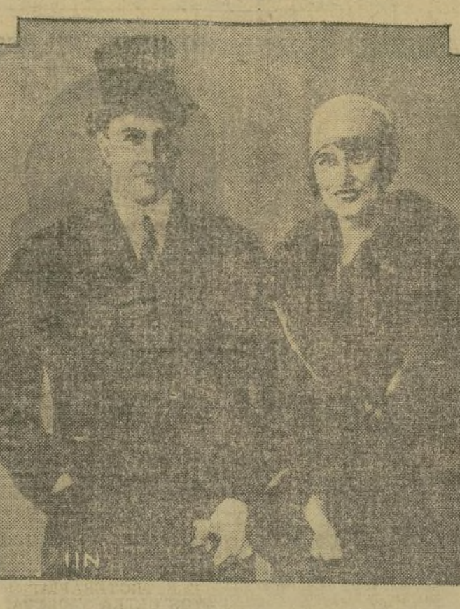
Esta fotografía muestra a los prometidos príncipe Olav, heredero de la corona noruega, y princesa Marta, de la casa real sueca.