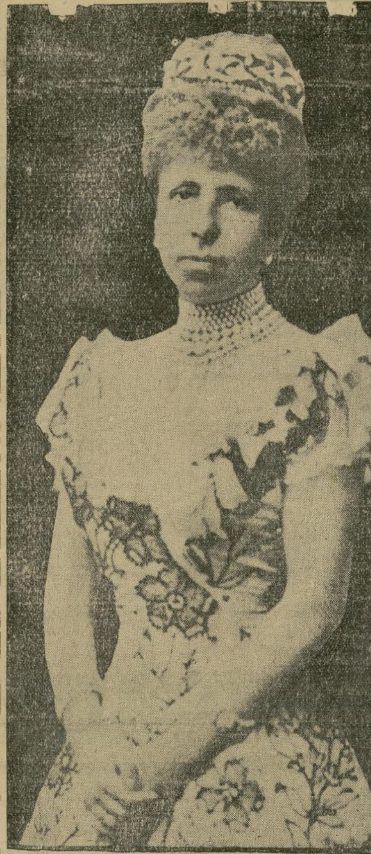
S. M. la Reina Da. Maria Cristina