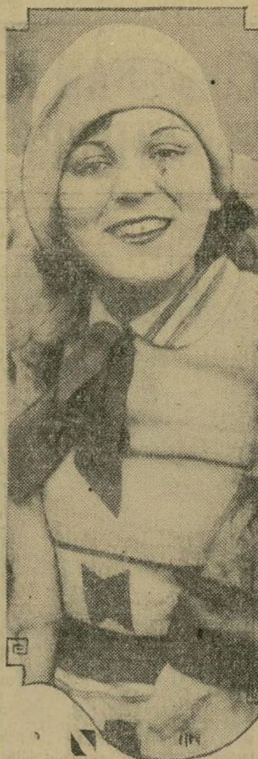
Lena Malena, estrella de la pantalla alemana, llegó recientemente a Estados Unidos para presentarse en los "talkies" en Hollywood.