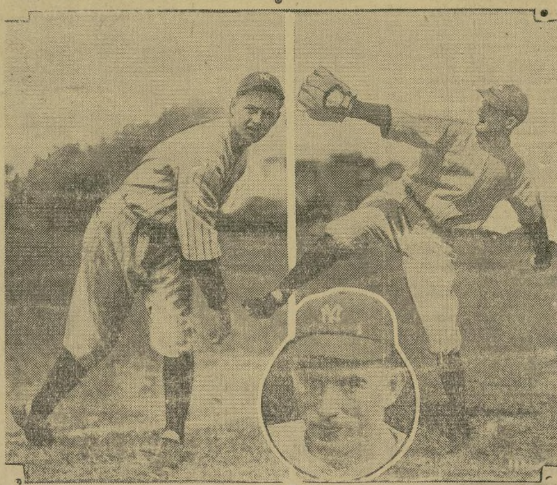
Aunque viejos en lo que se entiende debe ser la edad de un jugador, estos tres señores: Hoyt, Pennock y Zachary (de izquierda a derecha), están convencidos de que conservan todavía una buena cantidad de baseball entre ellos que les permitirá contribuir grandemente al triunfo de los Yankees la próxima temporada desde el "box".