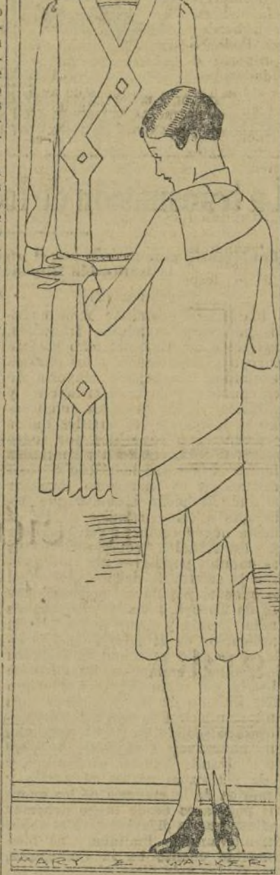
Suspendiendo el traje en el colgador se pueden ver mejor sus detalles.

abuelas se pasaban la vida zurciendo y haciendo las camisas de su esposo. Pero es, acaso, ahora