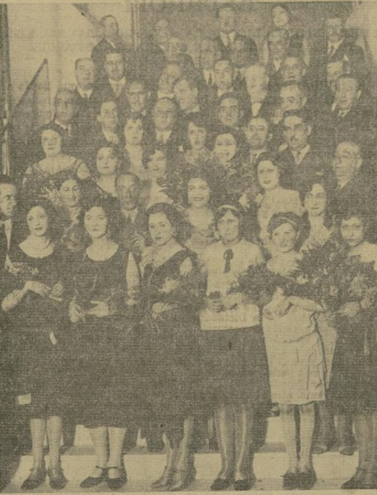
Distinguidas señoritas madrileñas tomaron parte recientemente en un concurso de belleza celebrado durante el curso de brillante fiesta patrocinado por el Círculo de Bellas Artes de Madrid.