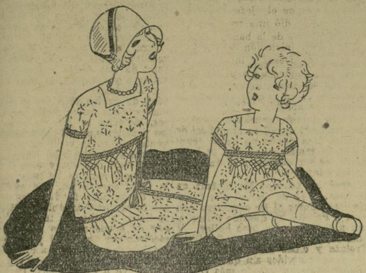
Los niños deben sentarse en el suelo, y para ello han menester vestidos fácilmente lavables.

La diferencia continúa acentuándose mucho entre los trajes de vestir y los trajes sencillos que la práctica de los deportes nos ha impuesto forzosamente. Para adoptar trajes sencillos o trajes sencillos hay que tener en cuenta ante todo, la vida que cada