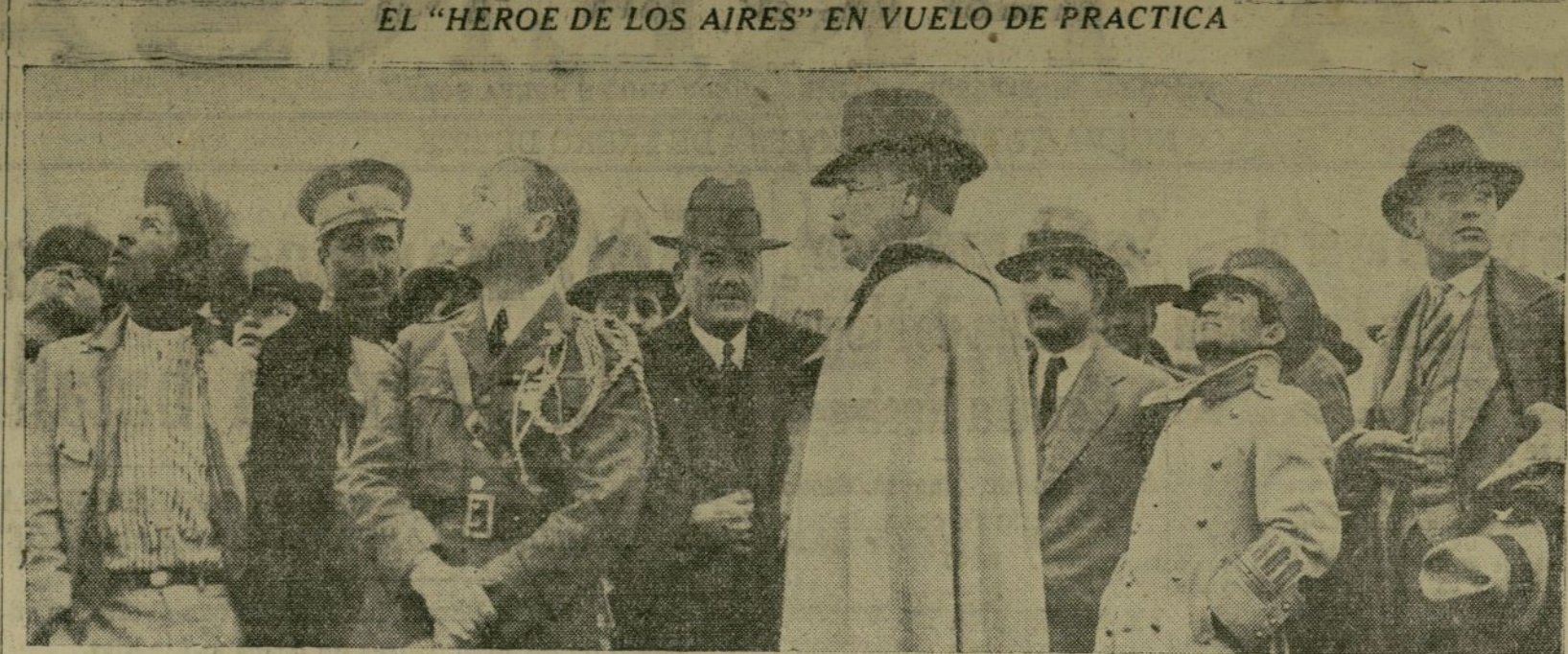
Esta original fotografía fue tomada cuando el coronel Lindbergh se encontraba aún en la ciudad de Méjico, en el día en que se dirigió al aeródromo de Valbuena, llevando como pasajeros en su "Spirit of St. Louis" al presidente Calles, al general Obregón y otras personalidades.

Cuando los marinos y la guardia nacional se aproximaron, los soldados de Sandino rompieron los fuegos con rifles, ametralladoras y artillería ligera. También lanzaron