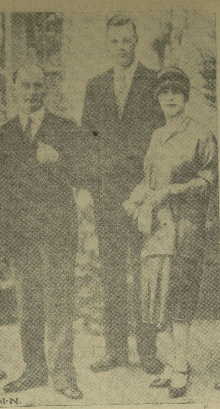
Esta fotografía fué tomada a la entrada de la legación de los Estados Unidos en Guatemala, donde el ministro norteamericano y su esposa recibieron al coronel Lindbergh.

delegación norteamericana al Congreso del Niño en la Habana.