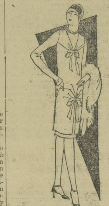
Vestido de gabardina con refajo de satén, asomando bajo el ruedo, disimula lo corto de la falda.

los telares no se cuenta las que han ocasionado la abolición de las enaguas y otras prendas de uso interior.