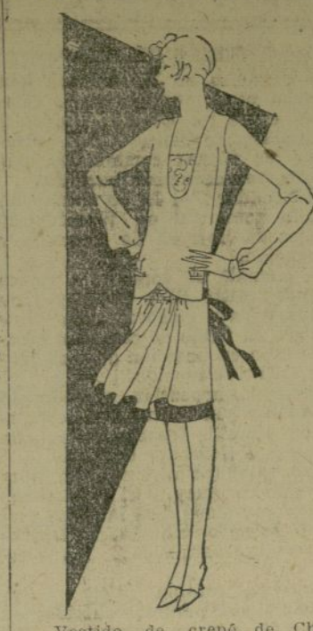
Vestido de crepé de China, muy corto, con refajo de satén, asomando bajo el ruedo.

es para señoras que parte el alma. La reducción de las faldas y también la de los abrigos supone en Alemania en el año último con relación a hace diez años, casi cuatro millones de metros menos de te-