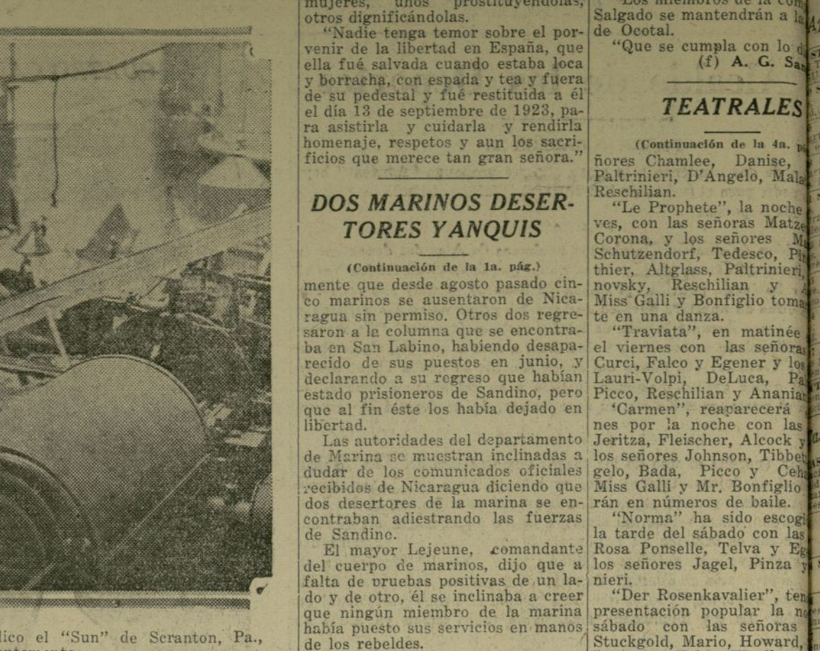
Estado en que quedó convertida la sala de máquinas del periódico el "Sun" de Seranton, Pa., contra el que manos criminales colocaron una poderosa bomba recientemente.

EL GENERAL PRIMO DE RIVERA DICE (Continuación de la 2a. pág.) intereses de España y de la colonia española en la Argentina. Detalles del banquete MADRID, 6.—Tres horas y media duró el banquete que el gobierno español honró al señor Estrada. El general Primo de Rivera y el señor Estrada ocuparon la presidencia del banquete, acompañados respectivamente del nuncio del Papa, del embajador de Bélgica y de los ministros de Gracia y Justicia y Marina. El general Primo de Rivera impulsó al señor Estrada el "primer cop" el que se le entregó encuadrado en la última copa por la adquisición de los barcos recientemente comprados por el gobierno argentino. Es la más importante, ascendiendo a más de cien mil pesetas. La comisión del homenaje al señor Estrada ha preparado un álbum del general, el álbum va adornado con el retrato del general, con el que forma la cubierta lleva una placa de oro con el busto del señor Estrada hecho por el gran escultor Mariano Benlliure. La portada fué dibujada por Moreno Carbonero, y contiene alegorías de España y la Argentina. El álbum va adornado con el retrato del general, con el que forma la cubierta lleva una placa de oro con el busto del señor Estrada hecho por el gran escultor Mariano Benlliure. La portada fué dibujada por Moreno Carbonero, y contiene alegorías de España y la Argentina.