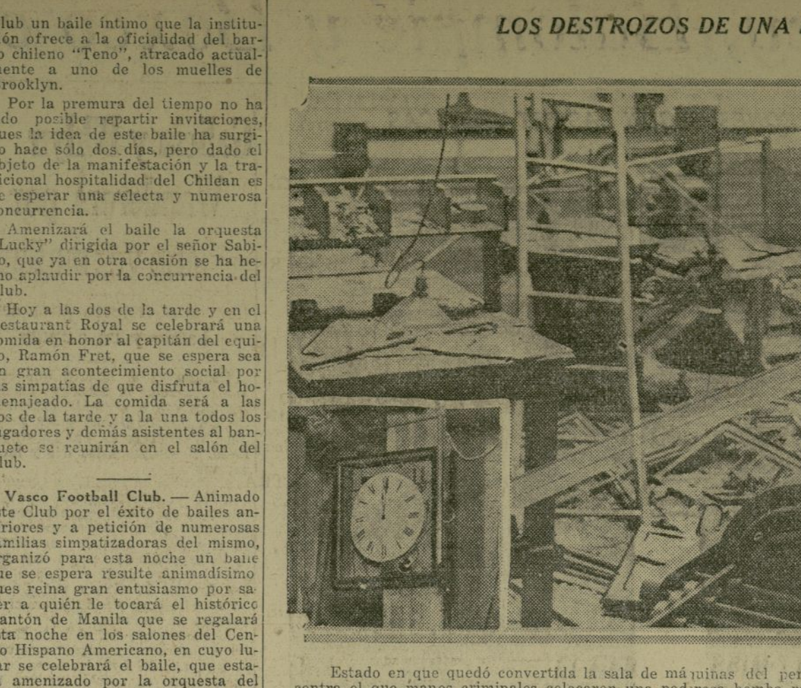
Estado en que quedó convertida la sala de máquinas del periódico el "Sun" de Seranton, Pa., contra el que manos criminales colocaron una poderosa bomba recientemente.

AGENCIA FUNERARIA En caso de Defunción Llame a "Trafalgar 8200" FRANK E. CAMPBELL "THE FUNERAL CHURCH" INC. BROADWAY y 66th STREET