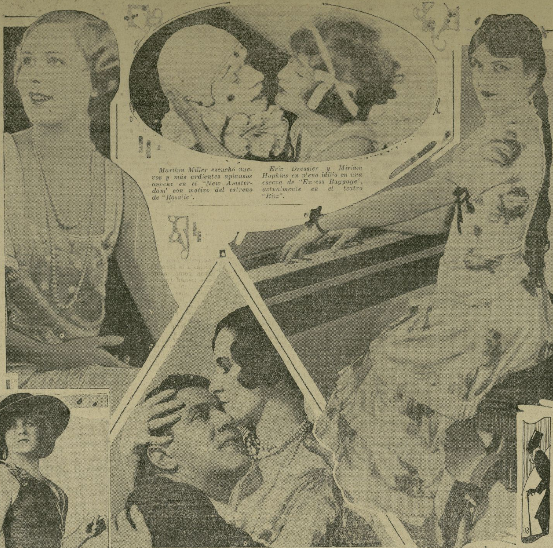
Marilyn Miller escuchó nuevos y más ardientes aplausos cuando en el "New Amsterdam" con motivo del estreno de "Rosale".

La obra es una que demuestra diferencia de caracteres, ideales e intereses, en vez de una de discursos y arbitrariedad. El teatro que deseen encontrar en esta obra una oportunidad de ver algo que sea una gran obra de las artes, hallarán en ella lo que se llama "Marco's Millions". Mr. Reinhardt ha adoptado como su técnica el método de colocar carácter en la obra, y en ella el choque de caracteres opuestos mediante la acción y la consecuencia en vez de las palabras.