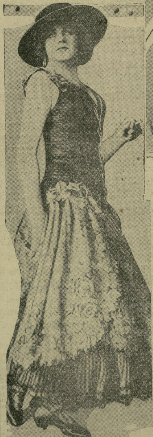
Maria Jeriza, la celebrada cantante de ópera, quien el próximo viernes por la noche cantará por primera vez en este país el papel de "Carmen" en la Metropolitan Opera House.