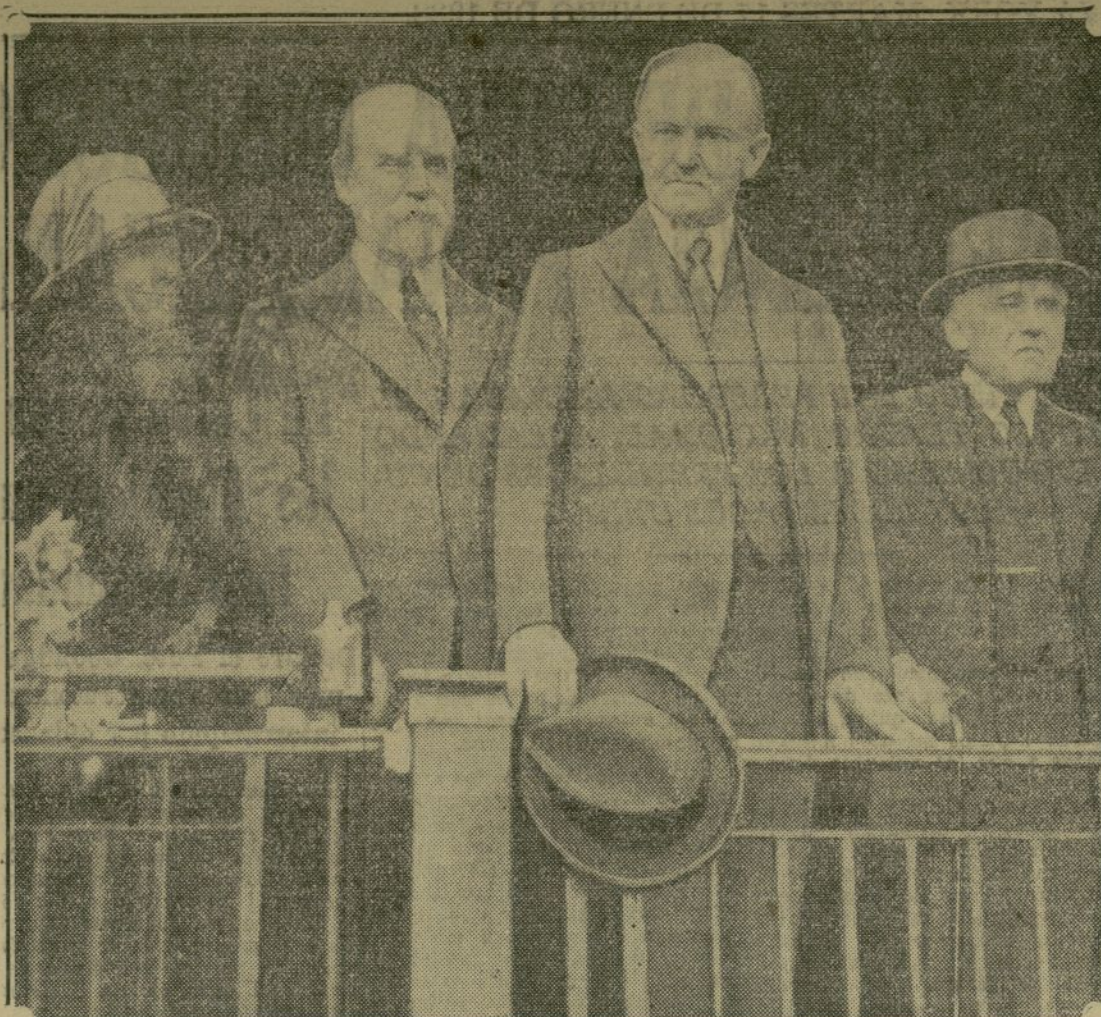
Esta fotografía fue tomada cuando el tren a expreso que condujo al presidente Coolidge y su comitiva desde Washington a Cayo Hueso, le graba a esta última estación, preliminar a su partida rumbo a la Habana en el gran acorazado "Texas". Junto con el presidente aparecen su señora, el exministro de Estado Charles E. Hughes y el actual secretario de Estado Kellogg.