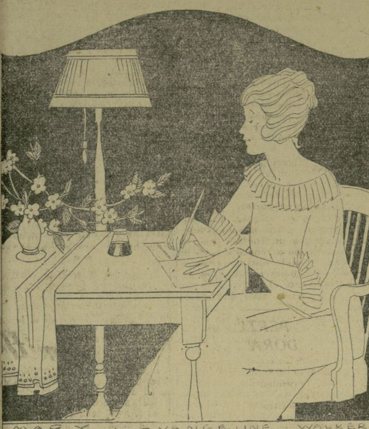
Las flores colocadas sobre la mesa de la mujer que escribió, ponen una nota femenina en el conjunto y dan inspiración a la mente.

Las mujeres en la Conferencia Panamericana de la Habana. El "National Women's Party" o el Partido Nacional Femenino, su afán de esparcir sus doctrinas.