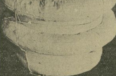
El tambor salvavidas inventado por Bonilla

Imposicionado por esta tragedia, y habiendo además ocurrido similares accidentes en Manila y en otros lugares, se propuso con toda fe dar