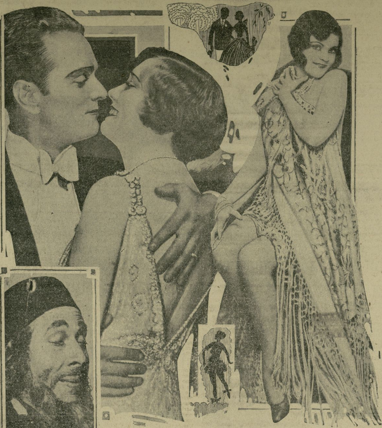
El gran actor inglés George Arliss caracterizado en "Shylock" en "The Merchant of Venice", que Winthrop Ames presenta en el teatro "Broadhurst".

Mr. Tripp, presidente de la Panamerican Airways Inc., que ha inaugurado hoy el servicio entre Cayo Hueso y la Habana, ocupará un lugar entre los veintidós delegados, formando parte del comité de aviación. Cree dicho señor que las sesiones serán fructíferas para la apertura de líneas en el Sur de América.