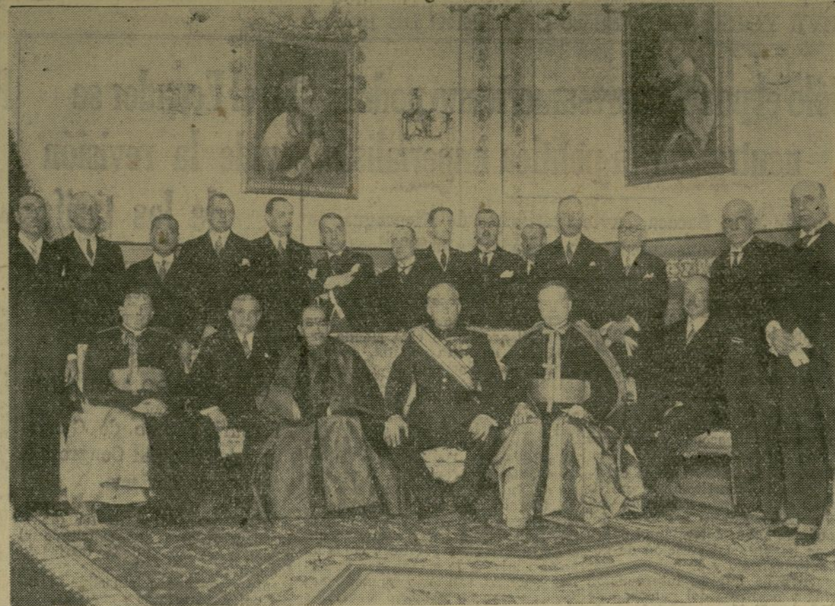
S. E. el nuevo cardenal arzobispo de Toledo, monseñor Segura y Sáenz (a la derecha del general Primo de Rivera) después del banquete celebrado en su honor en el palacio de la presidencia de la república, con el presidente del consejo de ministros general Primo de Rivera, el nuncio de su santidad el papa, monseñor Tuccillo y el grupo de embajadores extranjeros que asistieron al agasajo que le fué ofrecido por los altos jefes del gobierno y de la iglesia, con motivo de su nombramiento para el cardenalato.