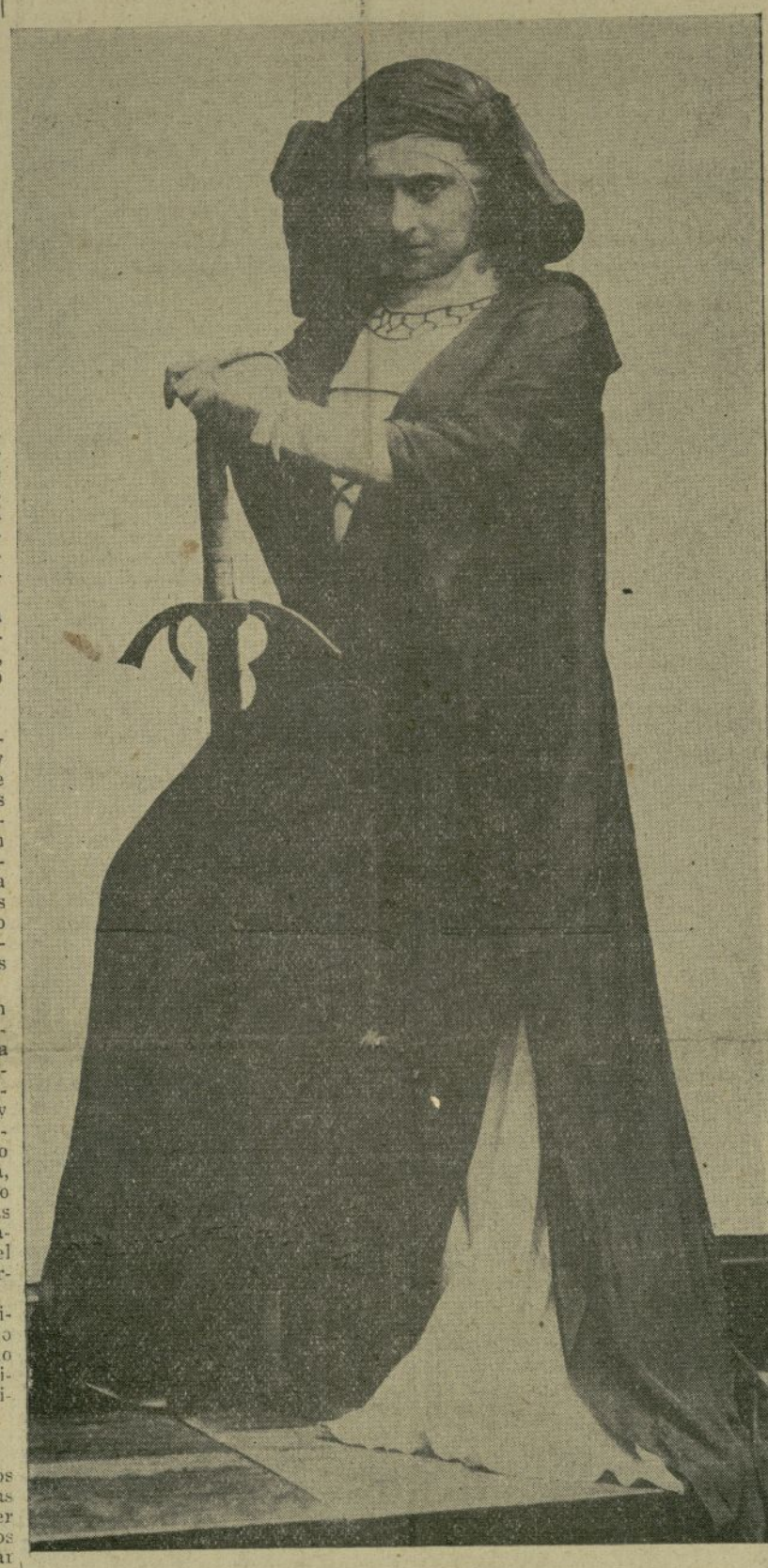
Doña María Guerrero de Díaz de Mendoza

Al par que España, la América española y el mundo entero hacen constar el tributo merecido a la memoria de la que fue figura eximia de la escena española, doña María Guerrero de Díaz de Mendoza, cuyo sentido fallecimiento acaeció ayer en Madrid, Broadway ha querido también que conste su profundo