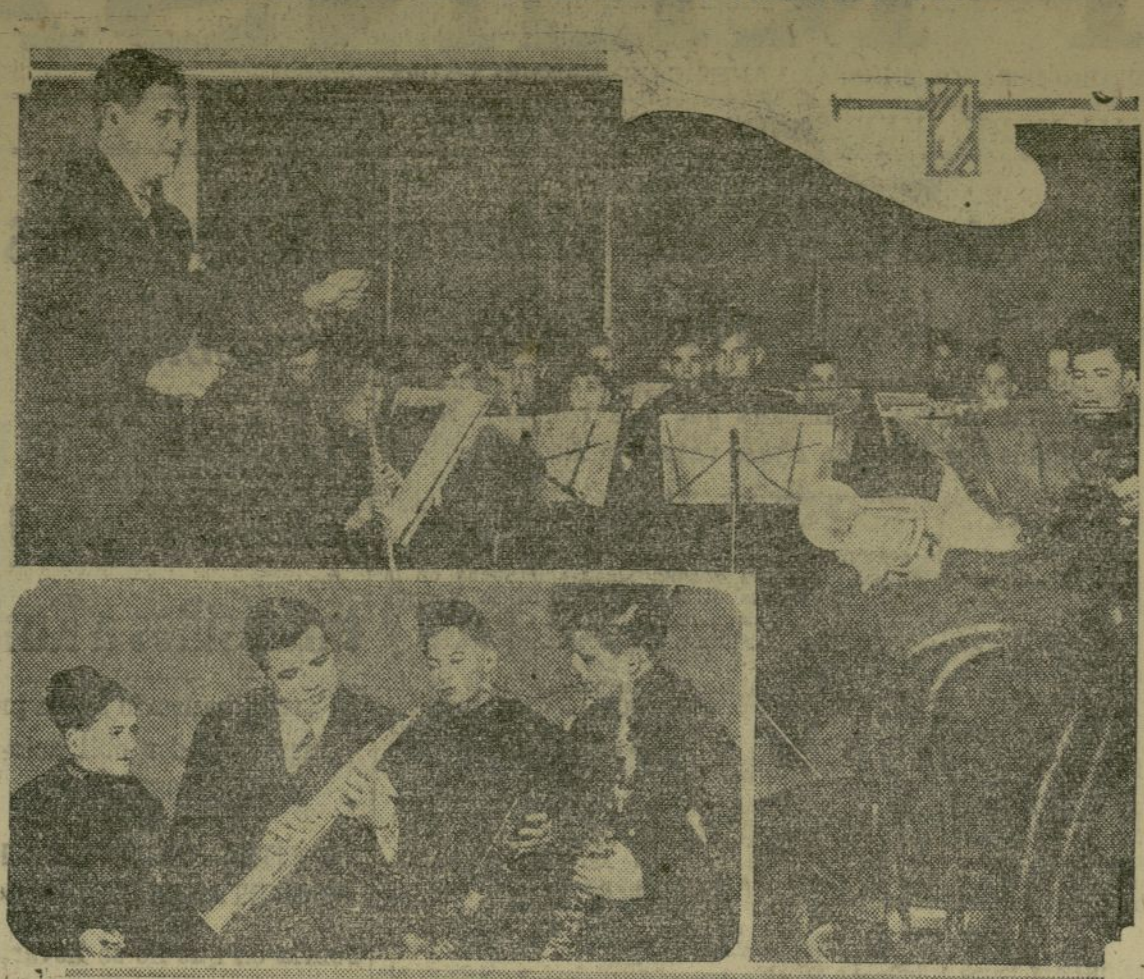
Esta fotografía nos muestra al famoso "bebbero" dirigiendo la banda de la escuela donde aprendió las "tres eres" así como a manejar el bati por primera vez. En la parte inferior aparece "Babe" Ruth dirigiendo a unos cuantos aprendices a través de los misteriosos teclados de un saxofono.